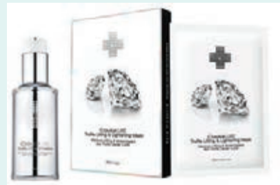
■Caviar LUXE Truffle Lifting Emulsion 系列

而出名平靚正受OL及女星歡迎的Neutrogena，突破性發現轉換肌，推出了全球首款專為「轉換肌」而設的HYDRO BOOST RENEWAL水活新生系列，由精華素、煥活露及水凝霜3款產品組成強勁更生團隊。當中的矚目新星水活新生精華，以滴管式設計，採用最新「肌膚煥活科技」，匯聚獨特「植物性CMLP萃取精華」的活肌更生能量及「雙重分子透明質酸」的肌底保濕力，每滴濃郁柔滑的精華都能深入細胞，將煥新活力源源不斷注入肌底，激活細胞更生，一般只需4星期便可見效。