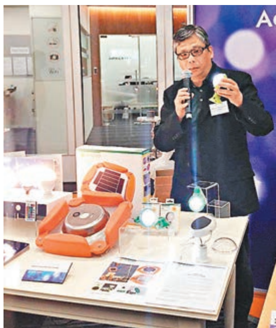
■ Nokero公司負責人正介紹為落後地區研發的太陽能燈泡。

世界銀行稱,2015年除中國以外的發展中東亞地區增長率料持穩在4.6%,與去年相若;在2016年將加速至4.9%,分別低於前一次預估時的成長5.1%和5.4%。