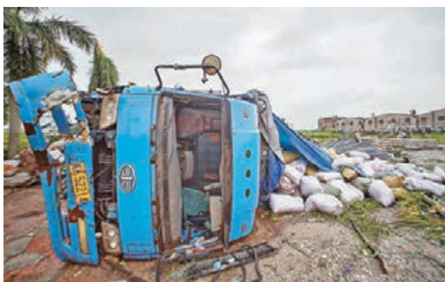
■昨日，在廣東佛山，一輛卡車被龍捲風掀翻。

據新華社報道，記者從雲南省氣象局獲悉，颱風「彩虹」會對滇東南產生影響，該區將出現中到大雨，今日雲南大部多雲有分散性陣雨。