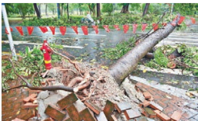
■風雨過後，廣州市區多處綠化樹被連根拔起倒在道路中央，堵塞交通。

記者從廣西壯族自治區水文水資源局獲悉，廣西南部及東南出現強降雨。預計玉林、貴港及北海東北部、欽州東北部、梧州南部、南寧東部、來賓東南部等區域的中小河流將出現較大幅度漲水，部分將出現超警戒洪水。廣西水文水資源局於昨日4時發佈洪水藍色預警，提醒相關單位及社會公眾加強防範，及時避險。