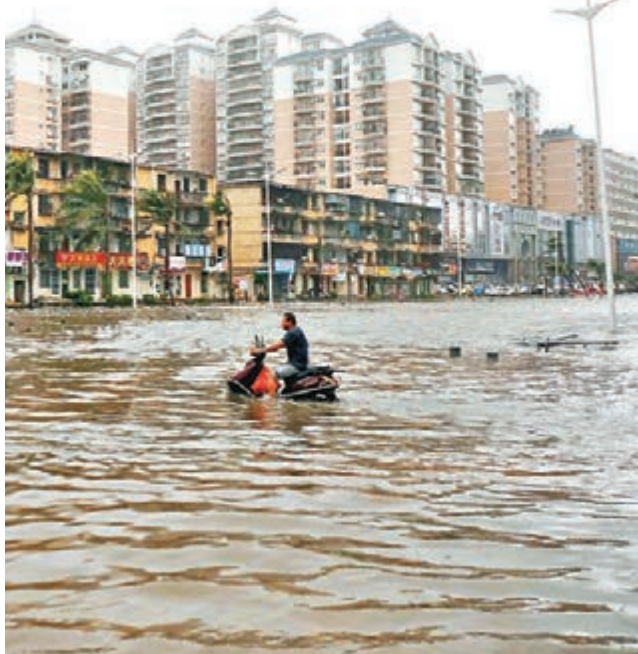
■湛江市受颱風「彩虹」吹襲後，主幹道海濱大道變「澤國」。

據廣東佛山順德區政府新聞辦昨日通報，龍捲風導致當地多處高壓電塔、廠房、民宅、魚塘等財產受損，轉移民眾約300人。