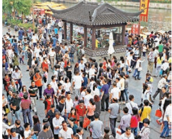
■昨日是內地國慶假期第5天，大批市民和遊客在南京夫子廟廣場上遊玩。

「現行的假日制度，造成出遊時間過於集中，帶來一系列負面影響：如交通嚴重擁擠、安全壓力大、景區生態環境不堪重負、消費體驗質量下降等。實行錯峰休假、增設地方性節假日等措施，或可破解帶薪年休假落實難的問題。」國家旅遊局綜合協調司有關負責人表示。