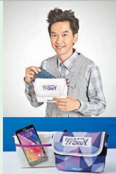
■「ASUS ZenFone 2 Deluxe x MeeH」shoulder bag