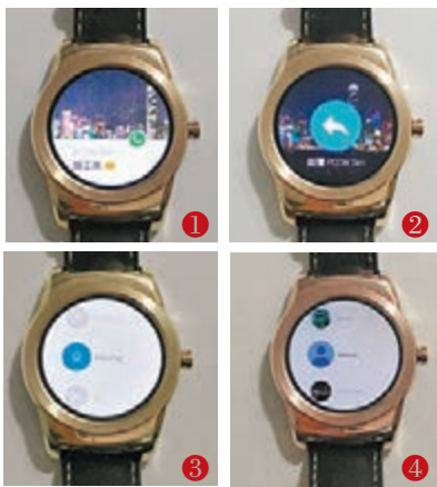
■回覆友人訊息步驟

是第一款內置最新Android Wear系統的智能手錶，加入多個全新功能，包括支援Wi-Fi連線，只要用戶手上的Watch Urbane連接Wi-Fi，手機又取得數據連線，即使手機不在身旁，它仍然可以單獨運作，例如接收訊息通知，大幅提升靈活性。同時，用戶以Watch Urbane回覆好友訊息的時候，可以直接以指尖在錶面上繪畫圖案，手錶會自動辨識然後轉換成相關的emoji，增添互動的趣味。用戶亦可以按需要調整手錶上的字體大小以及啟動自動鎖屏等，一系列貼心的新功能讓用戶獲得前所未有的體驗。