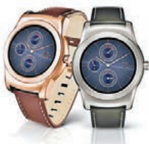
■LG Watch Urbane 售價：HK$2,998