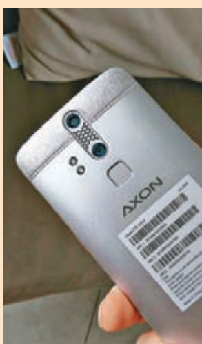
■搭載對稱的雙鏡頭與雙色溫LED閃光燈組合。

中興通訊(ZTE)早前在香港舉行新品發佈會，推出旗艦新機ZTE Axon Elite，並在今年9月全球最大電子展之一的柏林國際電子消費品展覽會中獲「2015 IFA產品技術創新大獎——使用者體驗金獎」，更成為今年唯一獲得IFA產品技術創新獎的中國手機品牌。這部旗艦新機Axon Elite為品牌首度面向高端市場推出的智慧型手機，專為商務族群打造，特地邀請曾為波音提供設計的Teague公司操刀設計，耗時18個月，精心打造出震撼人心的旗艦手機。新機機身尺寸只有154 x 77 x 9.8 mm，視覺厚度