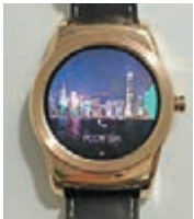
■錶面可隨你喜好選用相片