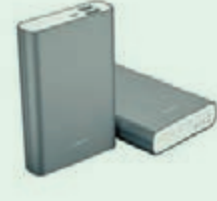
■HUAWEI AP007 售價：HK$159

當使用手機及智能手錶時，相信流動充電器是必備的，有見及此，不少品牌自家推出其流動充電器，價格還相當合理，如HUAWEI在香港推出全新AP007流動充電器，配備13,000mAh超大電池容量，支援雙USB輸出，同時備有智能休眠功能，減小電量損失，讓電力更加持久。實惠高質的AP007流動充電器獲得多國安全認證，而且能全面兼容市場上主流的流動裝置，用家既可安心使用，裝置又可全天候保持充足電量，暢心無阻地享受流動娛樂。