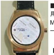
■在錶面使用Google Map，位置一覽無遺。

◀手錶還擁有兩個實用的獨家功能——LG Call及LG Pulse。有了LG Call，用戶就可以透過已連接手機的Watch Urbane取得電話裡最新通訊記錄以及最喜愛聯絡人資料，配上藍牙耳筒就能直接以手錶撥打電話。而LG Pulse則是手錶的健康監察功能，能在用戶進行運動時無時間限制下量度用戶的心跳率，並自動於結束後在Health軟件上展示心率圖，讓用戶更全面掌握健康狀態。