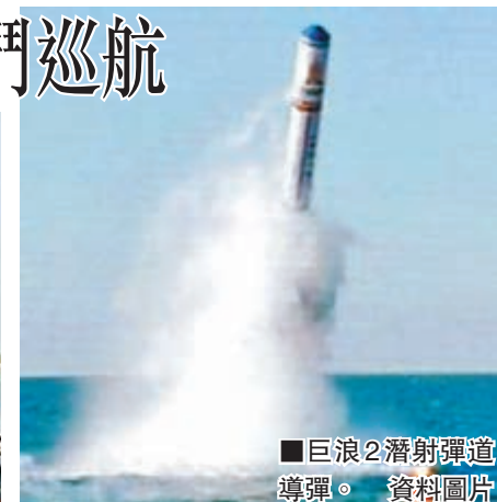
巨浪2潛射彈道導彈。資料圖片

報道稱，美國五角大樓國防情報局今年9月說，中國海軍很可能部署一艘載有巨浪2潛射彈道導彈的潛艇，但未指出具體日期。