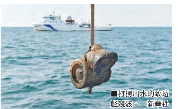
打撈出水的致遠艦殘骸。

香港文匯報訊 「丹東一號」水下考古在基本確認了致遠艦身份之後，昨日又進行了水下探摸，收穫重要發現。