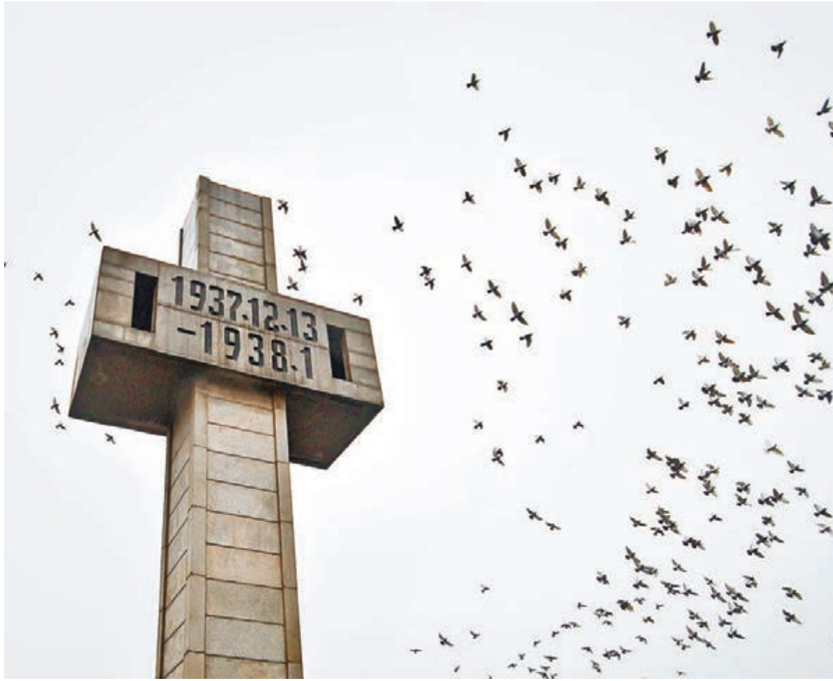
中國將南京大屠殺和慰安婦申遺，目的是要牢記歷史，珍惜和平，捍衛人類尊嚴。圖為南京大屠殺遇難者紀念碑。資料圖片

會議，審議包括上述申報在內的88項申報。據說結果將最快於4日晚在該組織網站上發佈。