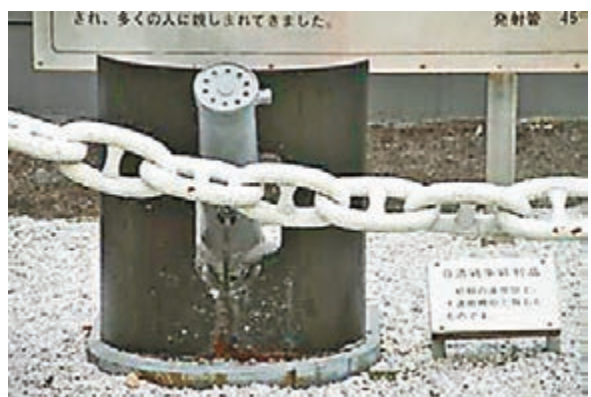
「致遠艦」機關炮被日軍作為戰利品在三笠公園展覽。

香港文匯報訊 中國海軍史研究會會長陳悅透露，甲午海戰後，北洋水師戰艦殘骸多被日軍打撈、拆分，當做戰利品陳列在靖國神社及學校和公園。