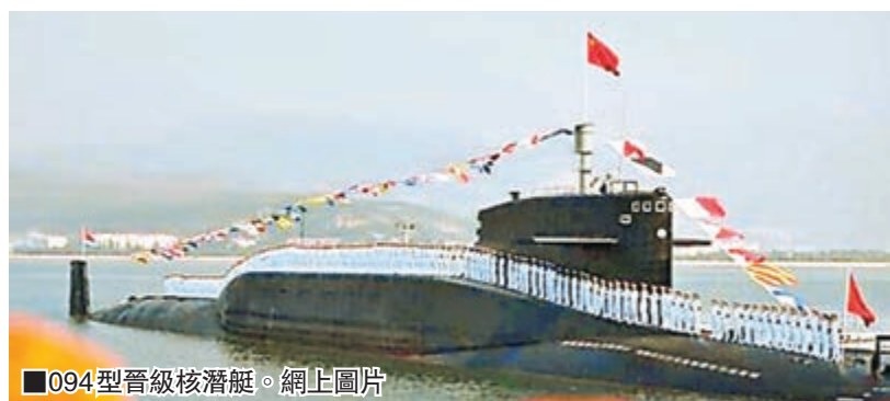
094型晉級核潛艇。網上圖片

香港文匯報訊 參考消息網引述外媒報道，一艘配有打擊範圍可達美國的導彈——中國094型晉級核潛艇可能已開始戰鬥巡航。