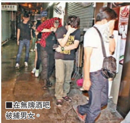
在無牌酒吧被捕男女。

香港文匯報訊（記者 杜法祖）警方昨凌晨採取反黑行動，在元朗泰祥街破獲一間懷疑由黑社會操控的無牌酒吧，檢獲共值7,000多元的酒精類飲品，拘捕13名男女，年紀最幼的「小酒客」僅14歲。