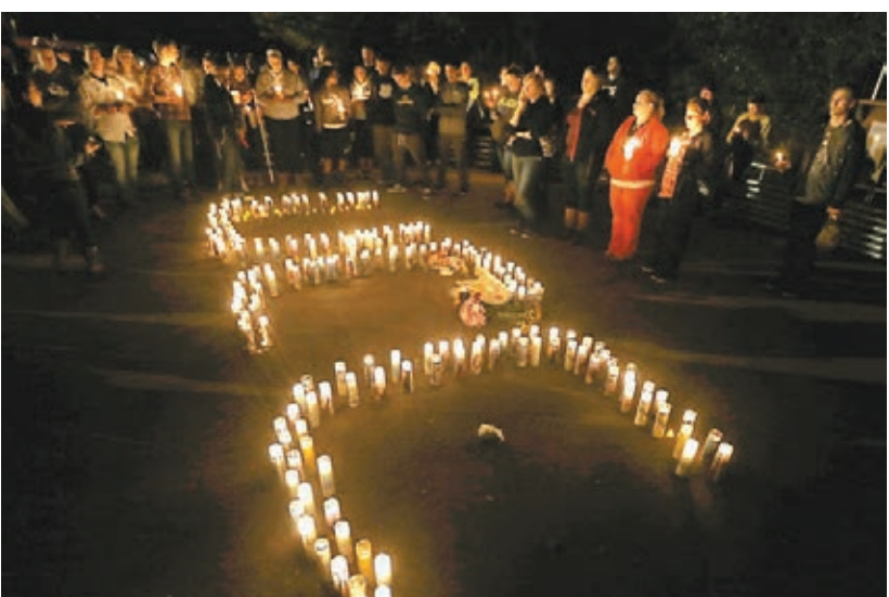
民眾點蠟燭悼念槍擊案死者。