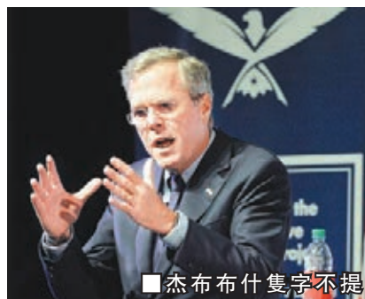
杰布布希隻字不提「槍」。