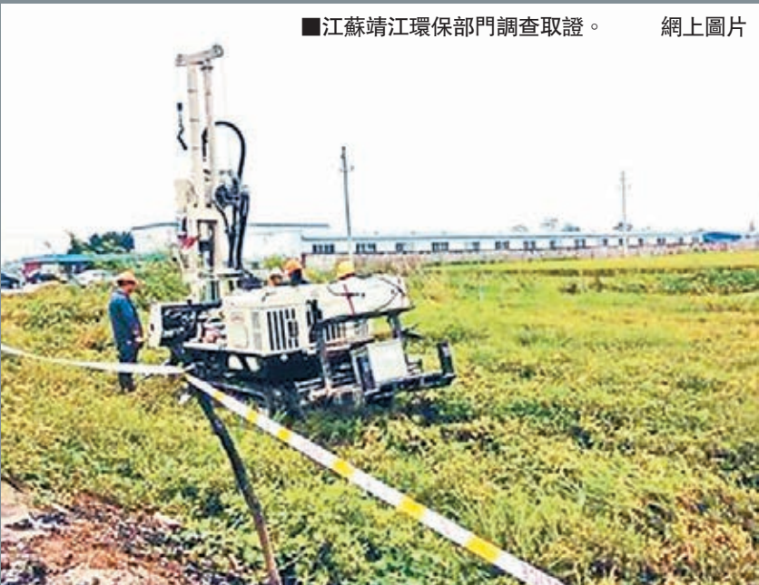
■江蘇靖江環保部門調查取證。