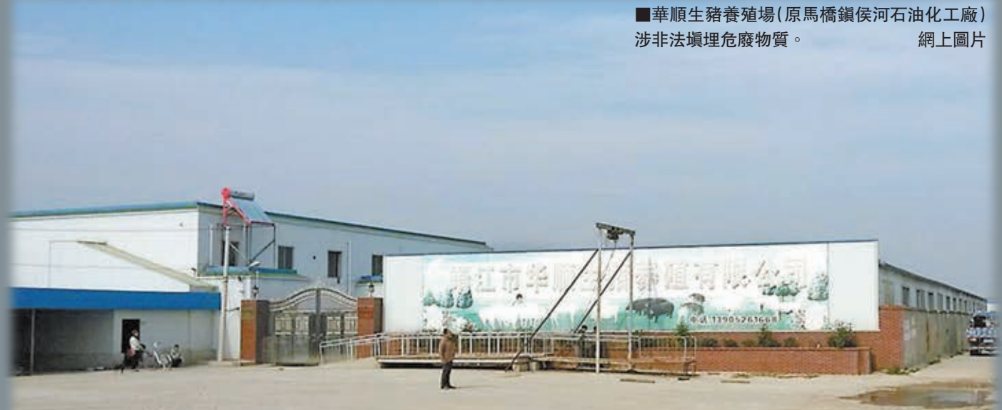
華順生豬養殖場(原馬橋鎮侯河石油化工廠) 涉非法填埋廢物。