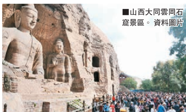
■山西大同雲岡石窟景區。 資料圖片

據新華社報道，專家學者用3年時間把雲岡石窟所有洞窟進行了攝影、測繪。內容上完全按照洞窟編號，從東到西，全面地再現雲岡所有石窟遺存，不僅包括保存較完整、完美的雕刻，也包括風化、有病害的雕刻。雲岡石窟距今已有1,500餘年的歷史，現存