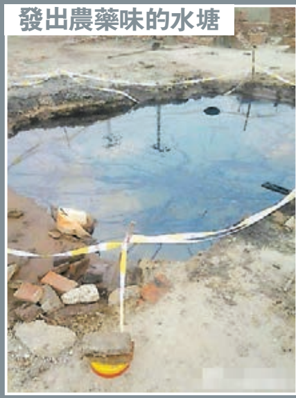
發出農藥味的水塘