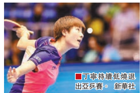
■丁寧持續發燒退出亞乒賽。