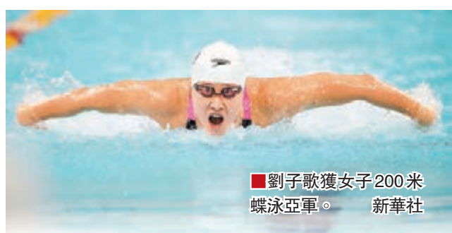
■劉子歌獲女子200米蝶泳亞軍。