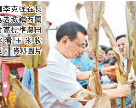
李克強在長葛老城鎮西關村高標準農田察看玉米收成。 資料圖片

今年1月1日，隨着河南省城鎮居民大病保險全部啟動，河南率先實現了大病保險城鄉居民全覆蓋。河南省對城鎮居民大病保險的財政補助也從最初60元增加至380元。「這意味着居民參保個人所需承擔的繳費比例將大幅下降，全民醫保參保人員個人負擔也將減輕。」河南省人社廳相關負責人接受當地媒體採訪時說。根據規定，大病保險實行醫療費用越多，報銷比例越高的政策，分段按比例報銷，年度最高支付限額為30萬元。