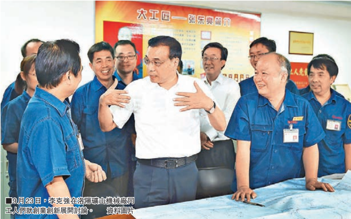
9月23日，李克強在洛陽礦山機械廠同工人們就創業創新展開討論。 資料圖片

有分析人士指出，李克強此次河南考察洛陽礦山機械廠大有深意，將會激發更多的大企業加入「雙創」大潮。