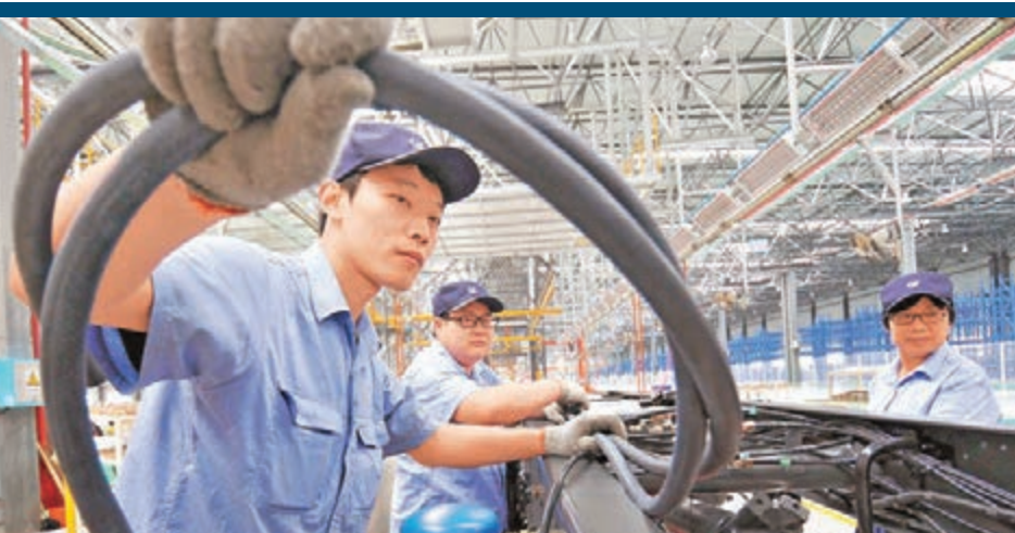
9月中國製造業PMI下跌兩個月後首度小幅回升，但仍低於榮枯線。圖為河北邢台工人在生產線上工作。 新華社

香港文匯報訊（記者 田一涵 北京報道）中國官方昨日發佈的9月中國製造業採購經理指數（PMI）為49.8%，這是該指數下跌兩個月後首度小幅回升，不過仍低於榮枯線。同日發佈的9月中國財新製造業採購經理人指數（PMI）已連續七個月低於榮枯線。專家分析認為，9月份PMI數值預示中國經濟下行態勢趨緩，但中小企業生產經營仍然較為困難，需要繼續加大政策的扶持力度。