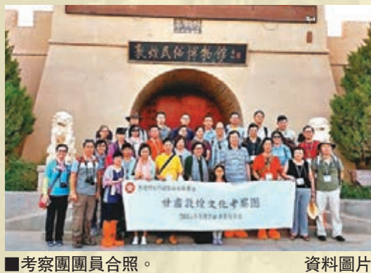
■考察團團員合照。 資料圖片

根據聯合國環境與發展世界委員會的報告，可持續發展是：「既能滿足我們現今的需求，又不損害子孫後代能滿足他們的需求的發展模式。」（《我們的共同未來》，1987年）要達到可持續發展的目標，「經濟、環境、社會」3方面必須互相協調平衡，不應過度發展任何一個，以避免危及另一個方面的發展。可持續發展建基於3個重要原則——公平、共同、持續。