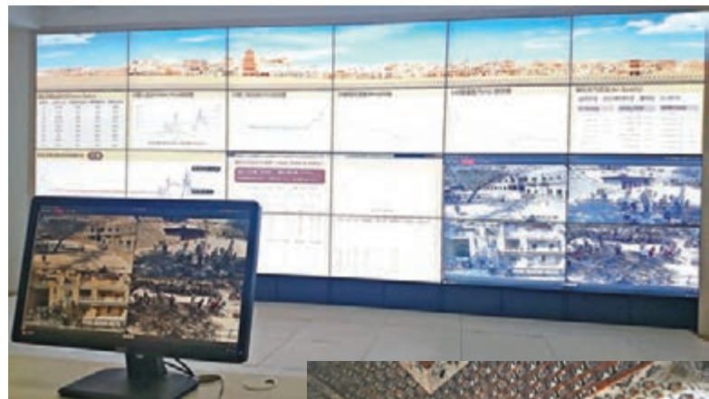
▲「洞窟調控中心」時刻監察洞窟內的二氧化碳量、濕度、溫度等。

以可持續發展的思維來看，莫高窟所推行的旅遊新模式，考慮到景點的承載力，達到文物保護與開放利用的雙贏，在「環境」與「社會」之間取得平衡。同時，也符合「持續」與「公平」的原則，一方面考慮到當代人的參觀體驗（公平），另一方面透過縮短遊客在洞窟內停留時間，減少對壁畫的破壞，盡力保存洞窟內的珍貴文物，讓後代人也有機會觀賞（持續），了解洞窟歷史文化。