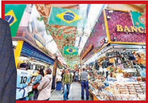
拉加德指巴西面對嚴峻經濟困難。

新興市場經濟和股匯近期出現動盪，國際貨幣基金組織(IMF)主席拉加德日前表示，受中國增長放緩、美國醞釀加息影響，今年全球經濟增長將差過去年。她又警告，新興市場過去20年的快速經濟增長將因商品市場持續疲弱而「處於險境」，若聯儲局年底加息，更可能引發惡性循環，拖累明年全球經濟。