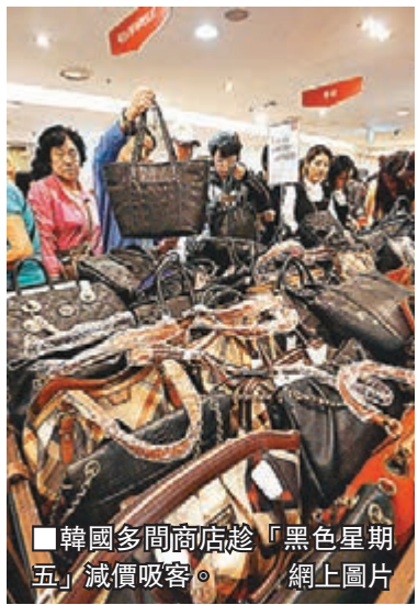
韓國多間商店趁「黑色星期五」減價吸客。