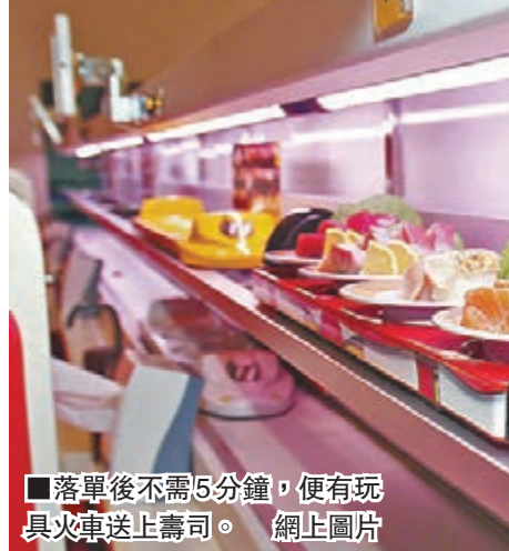
落單後不需5分鐘，便有玩具火車送上壽司。

玩具火車送壽司的概念存在已久，日本部分壽司店早已使用迷你彈火車載送壽司，顧客座位前的觸控式螢幕顯示不同魚類在水族箱裡游來游去，顧客觸碰某條魚時便代表點選，不需5分鐘便由玩具火車送上壽司。