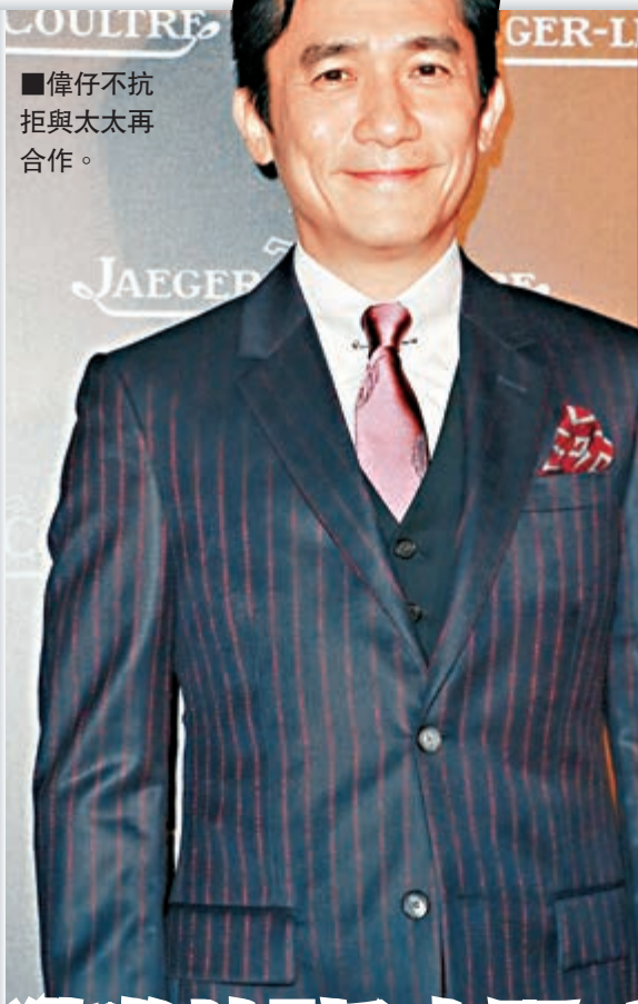
偉仔不抗拒與太太再合作。