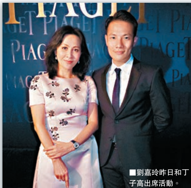
劉嘉玲昨日和丁子高出席活動。