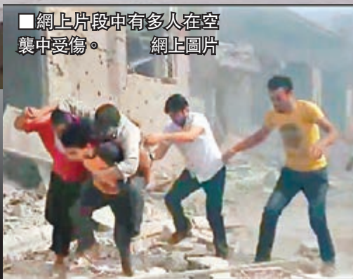
網上片段中有多人在空襲中受傷。 網上圖片