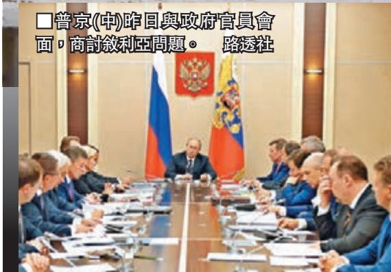
普京(中)與政府官員會面，商討敘利亞問題。