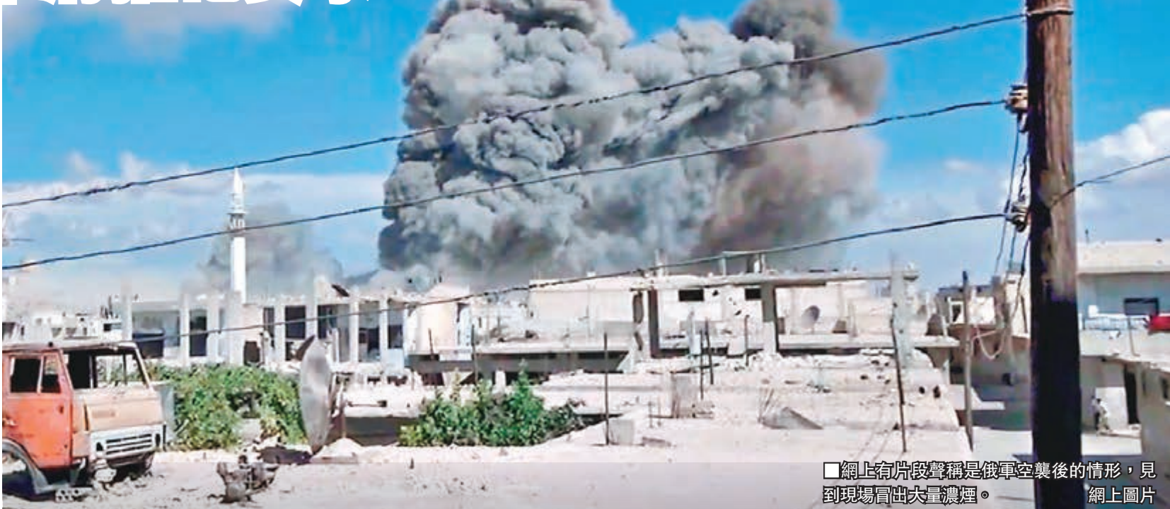
網上影片聲稱是俄軍空襲後的情形，見到現場冒出大量濃煙。