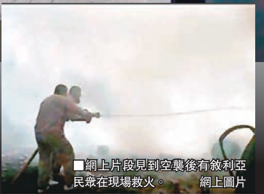
網上片段見到空襲後有敘利亞民眾在現場救火。