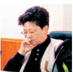
「紅色通緝令」頭號嫌犯楊秀珠紐約受審。 資料圖片

2005年,楊秀珠在荷蘭被捕,由於中荷沒有簽署雙邊引渡條約等原因,無法將其引渡回國,2014年5月,在即將被遣返中國前夕,她逃離荷蘭,並最終因為使用假護照在美國被捕。楊秀珠自從在美國被捕後關押至今,曾在今年6月於紐約移民法庭受審。