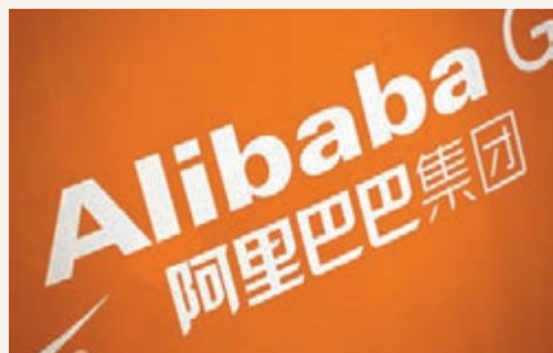
螞蟻金服宣佈進入新加坡及日本市場。

香港文匯報訊(記者 吳婉玲)螞蟻金服繼續開拓其海外市場,公司昨宣佈進入新加坡及日本市場,與環球影城聯手打造「智能樂園」,讓遊客可以用移動設備,連接遊樂園內所有的娛樂消費服務。同時,與日本Recruit合作,透過其智能POS網絡,讓內地遊客在當地用支付寶消費。