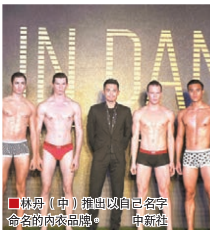
林丹（中）推出以自己名字命名的內衣品牌。