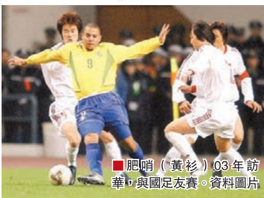
肥哨（黃衫）03年訪華，與國足友賽。資料圖片

巴西傳奇球星、「外星人」朗拿度（肥哨）巴西時間28日宣佈，已與投資人敲定在中國開辦30所足球學校，以自己的「羅氏足球教學法」助力中國足球發展。