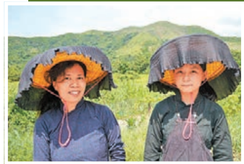
身穿傳統客家服飾的蓮麻坑村民。