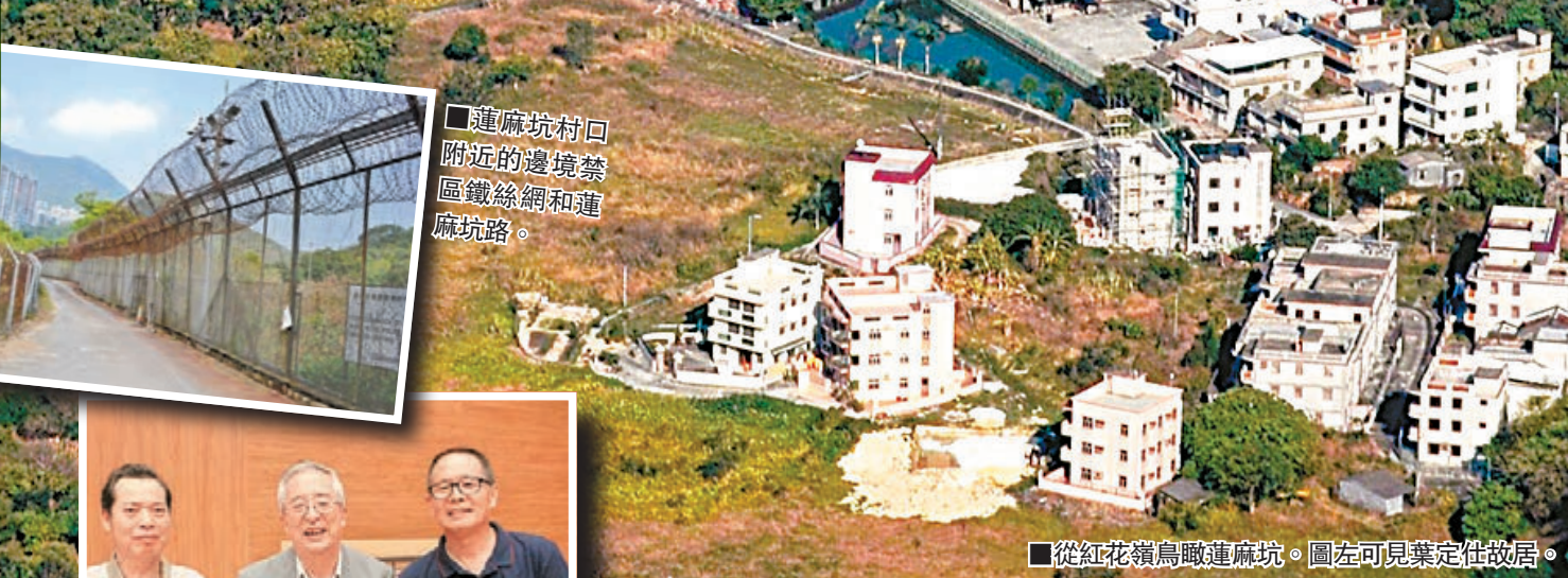
蓮麻坑村口附近的邊境禁區鐵絲網和蓮麻坑路。