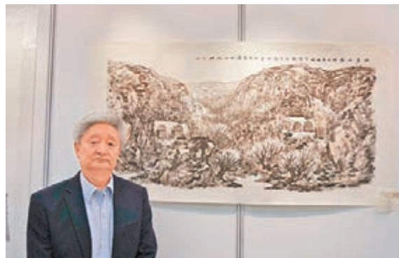
趙振川的作品《溝裡人家》描繪陝北偏僻山村的收穫印象。