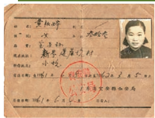
1960年代蓮麻坑村民使用的過境耕作證。