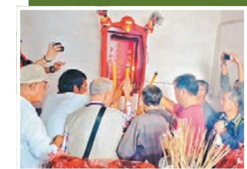
2014年11月，葉氏宗祠內舉行葉法諸公神位進伙開光儀式。

建於清朝康熙年間的蓮麻坑村，坐落在打鼓嶺和沙頭角之間，鄰近深圳河，北有梧桐山，西有黃茅山，南有塘肚山、禾徑山，西南方是紅花嶺，東北面還有蓮麻坑礦山，重山環抱，隱於翠綠之間。據劉蜀永介紹，1898年英國強迫清政府簽訂《展拓香港界址專條》租借新界，1899年又簽訂《香港英新租界合同》，將深圳河劃為邊界綫，導致深圳河兩岸的邊境村莊出現互有土地和房屋在對方管轄的情況。但一直到中國大陸解放前夕，深港邊界從未設任何哨卡。深圳河兩岸邊境村莊的居民均可以自由往來，無論是開荒種地，出海捕魚，還是走親訪友、趕墟交易，兩地間的聯繫從未中斷過。