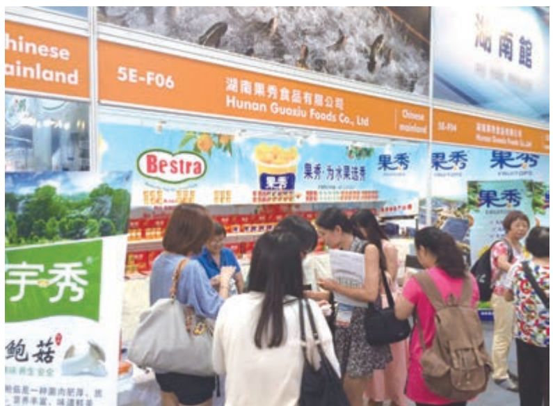
■果秀食品有限公司廣受市民青睞。

氣候溫和,冬無嚴寒,夏無酷暑,年平均氣溫15.4℃,優越的自然環境十分適宜茶樹生長,氨基酸含量高,酚氨比適宜。此外,玲瓏茶的製作工藝已被列入《湖南省非物質文化遺產》。