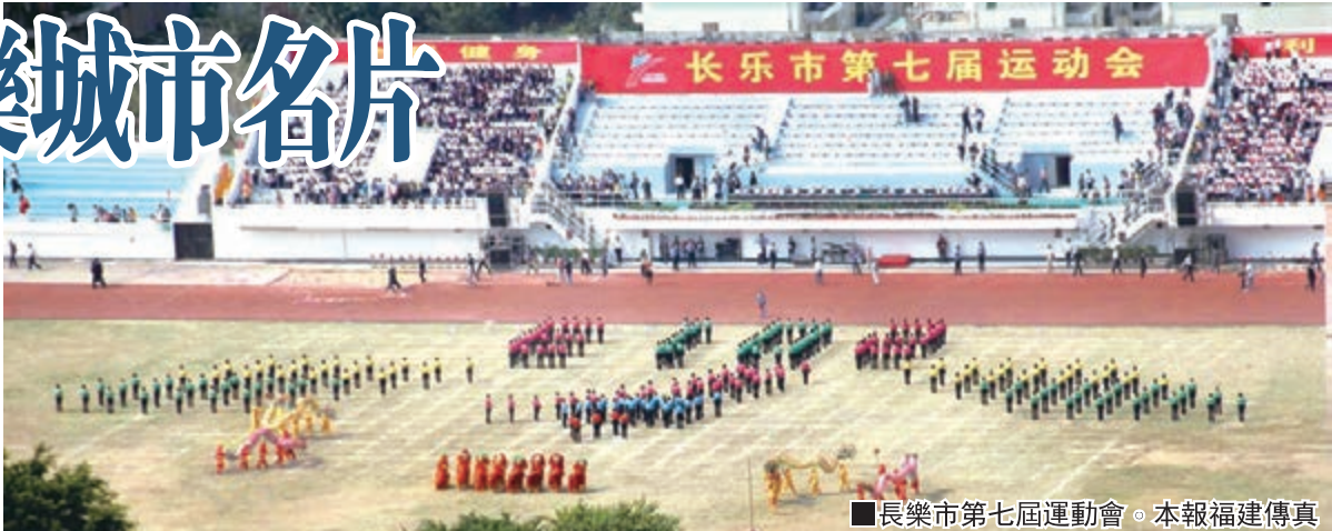
長樂市第七屆運動會。

據悉，長樂市以承辦全國首屆青運會爲契機，新建了長樂市體育中心、東湖水上運動中心等體育場所。場館建成後，給市民帶來青運體育「盛宴」的同時，