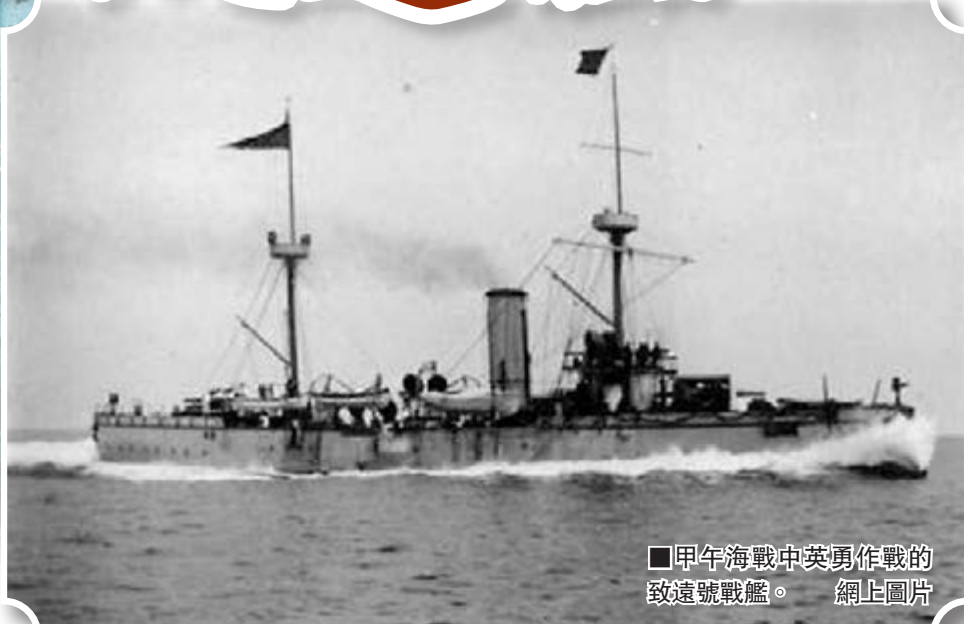
甲午海戰中英勇作戰的致遠號戰艦。

「丹東一號」沉船位於鴨綠江口西南約50公里海域，所在地曾爲1894年中日甲午海戰時的交戰海區。對於「丹東一號」沉船的水下考古調查由國家文物局水下文化遺產保護中心、遼寧省文物考古研究所聯合進行。由於之前對該沉艦的具體身份尚不十分明確，故將其暫命名爲「丹東一號」。