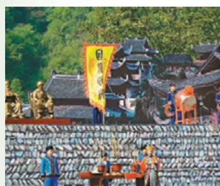
當地土家族在開園當日的捨巴節上展示祭祀文化。

以湖南永順老司城爲代表的中國土司遺址今年7月成功申報世界遺產。昨日，以遺址核心區爲主體的老司城國家考古遺址公園完成初期建設對外開放，老司城博物館也同步開館。