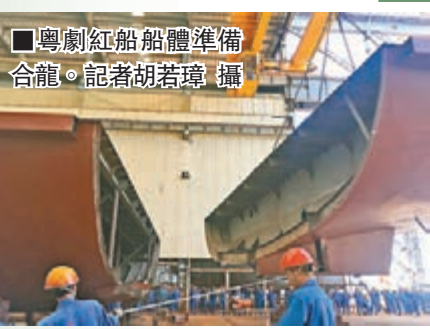
粵劇紅船船體準備合龍。

珠江最大遊船——粵劇紅船船體合龍儀式暨外形揭曉活動昨日在廣東莞莞麻涌鎮舉行。粵劇面臨着觀眾老化的現狀，難以吸引新觀眾，尤其是年輕觀眾的加入。粵劇紅船作爲一個流動劇場，未來希望吸引更多關注粵劇發展。