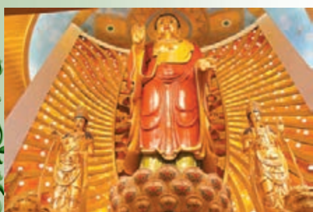
拍絲瑠璃工藝製作的釋迦牟尼佛，被認定世界最大。

在古興隆寺基礎上擴建的山東兗州興隆文化園，昨日開園試運行。於興隆塔地宮出土的佛頂骨真身舍利等47顆舍利，被安放在118米高的靈光寶殿最高處，重新接受世人朝拜。寶殿內的一尊釋迦牟尼拈絲瑠璃佛像，同日破健力士世界紀錄公司認定爲世界上最高大的室內瑠璃佛立像。