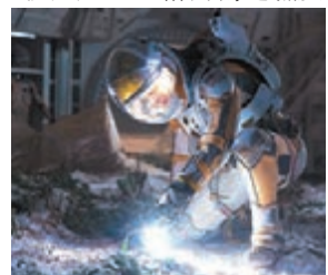
■《火星任務》講述太空人在火星上種植。

《火星任務》講述由荷里活男星麥迪文飾演的NASA太空人被困火星，藉由創造濕度及溫度在火星上造水，再用來灌溉馬鈴薯，讓他得以生存。NASA亦參與合作拍攝，片中多次出現NASA標誌。