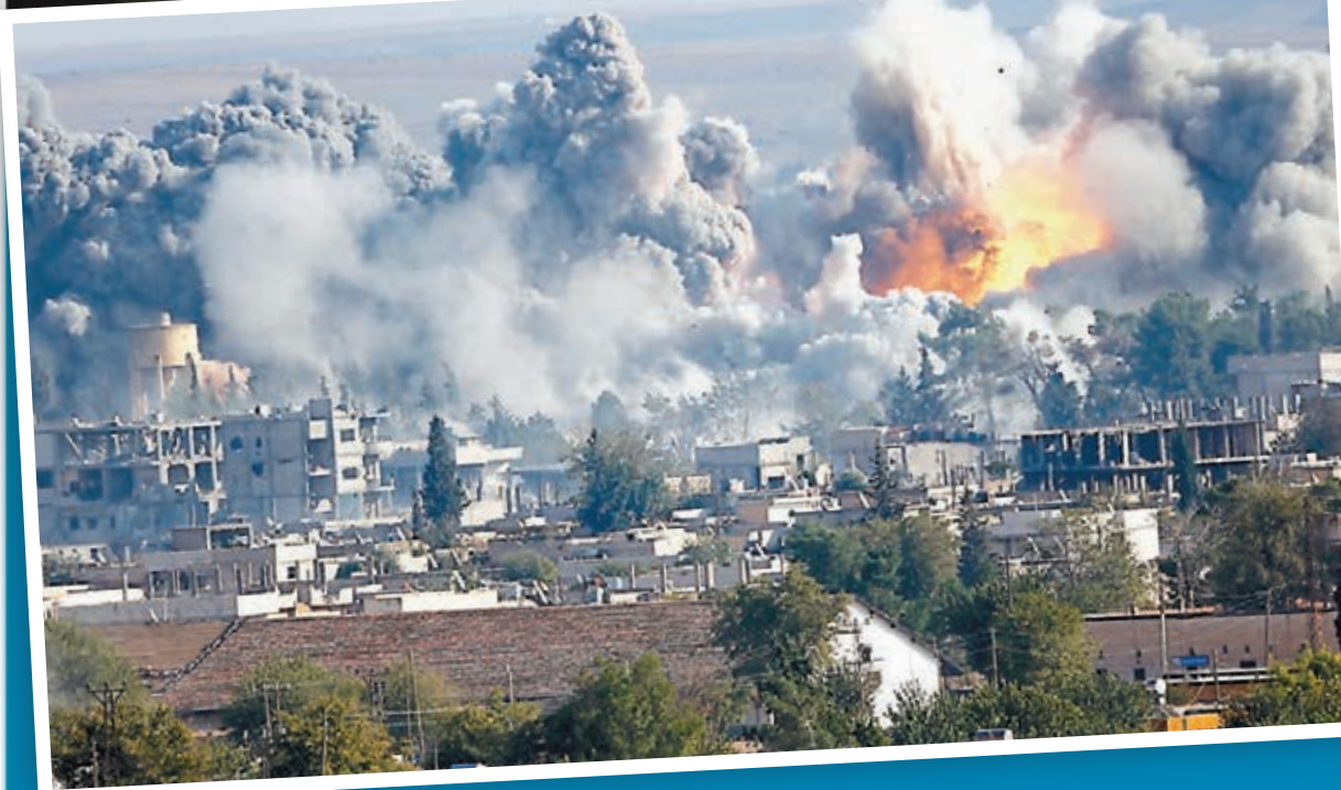
■普京指美國牽頭的阿拉伯聯盟空襲敘利亞屬違法。資料圖片

CNN：普京搶攻美領導地位 俄羅斯近來積極就敘利亞問題發聲，總統普京相隔10年再次在聯合國大會上發言時，花了不少篇幅探討敘利亞局勢，呼籲各國合作對抗恐怖分子。美國有線新聞網絡(CNN)記者柯林森指出，聯合國大會慣常是美國總統一展風騷的外交舞台，但奧巴馬前日明顯處於守勢，相反普京積極展開攻勢，矛頭不僅直指奧巴馬的外交政策，還有過去幾十年美國牽頭建立的世界秩序。