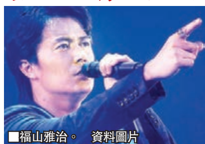
■福山雅治。

日本官房長官菅義偉昨日出演電視節目，被問到對演員福山雅治與吹石一惠結婚的感想時，他表示「以他們結婚為契機，希望媽媽們一同以積極生育的意願貢獻國家」。這可能會被解讀為敦促女性為國家生育的言論，或將引發爭議。