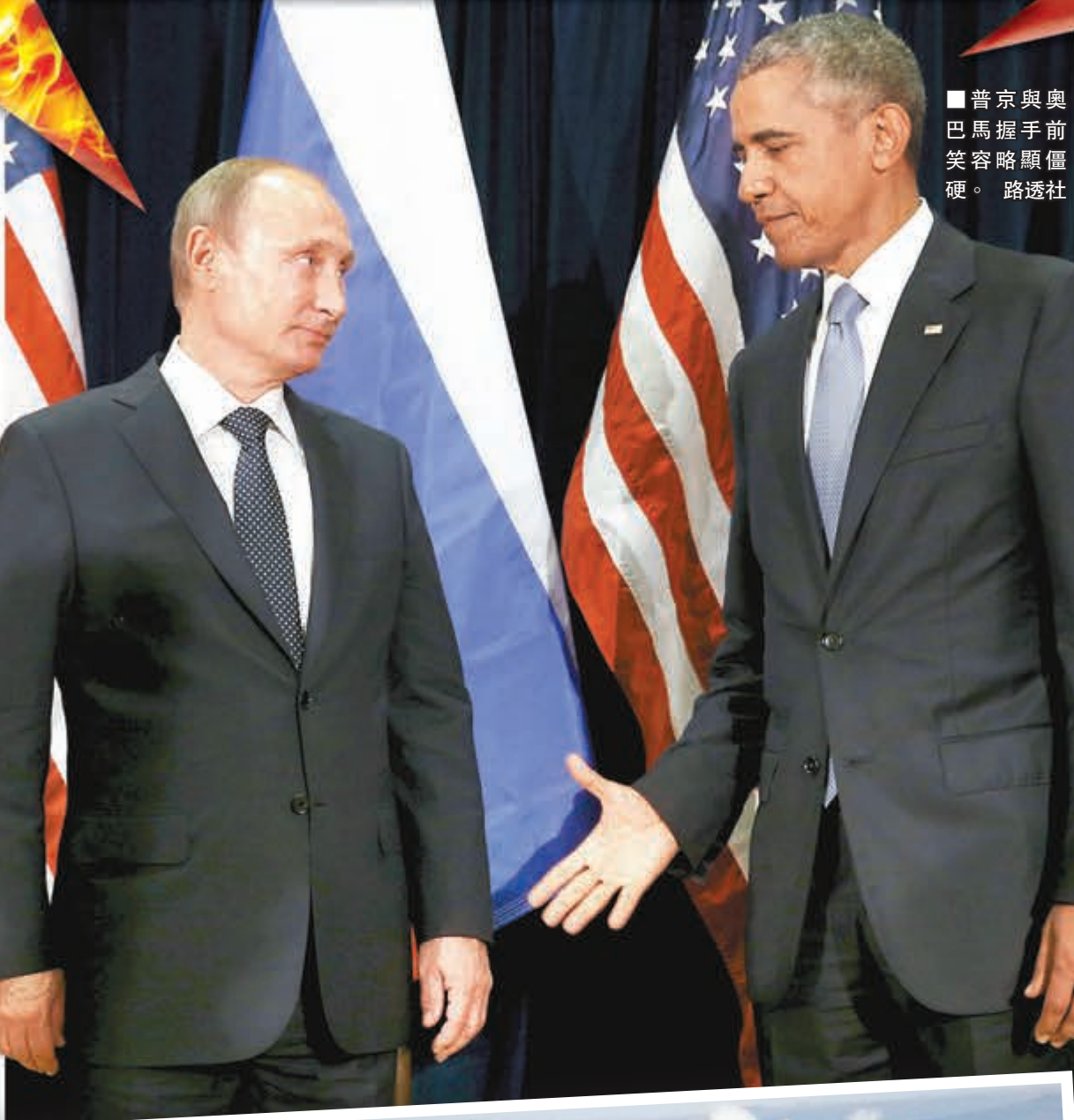
■普京與奧巴馬握手前笑容略顯僵硬。