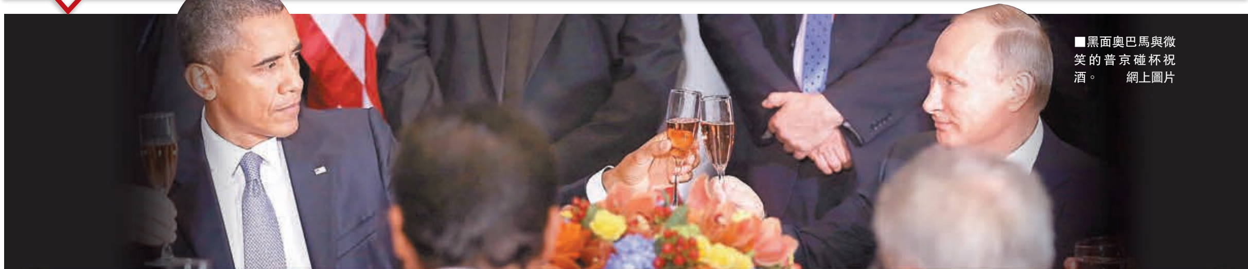
■黑面奧巴馬與微笑的普京碰杯祝酒。