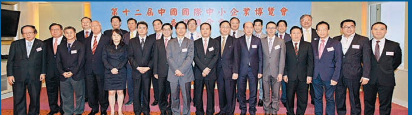
■第十二屆中國國際中小企業博覽會香港推介會

由中華人民共和國工業和信息化部、國家工商行政管理總局和廣東省人民政府主辦，香港貿易發展局協辦的第十二屆中國國際中小企業博覽會（簡稱中博會）將於2015年10月10日（周六）至13日（周二）在廣州保利世貿博覽館舉行。本屆展覽面積超過110,000平方米，設國際標準展位5000個，其中中國境內中小企業展位4000個，國外及港澳地區展位1000個，每屆觀眾數目平均達23萬人次。香港區設於二樓4號館（港澳台、國際館）內，在十多個國家和地區中佔地最大。