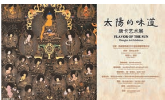
■「太陽的味道」唐卡藝術展

為弘揚並傳播西藏的傳統文化藝術，讓更多人了解唐卡的藝術魅力，2015年10月，深圳弘法寺將舉辦「太陽的味道」唐卡藝術展，展出四十多幅精美絢麗的唐卡和十多尊佛教造像，全部由西藏攀德達傑文化藝術傳播有限公司的藝術家們潛心創作。