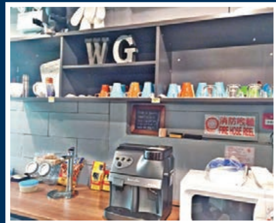
■銅鑼灣啟迪空間。