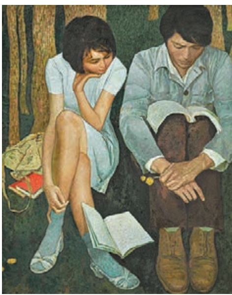
■黃冠餘《我們正年輕》1980年作 油彩畫布 估價：80萬至120萬港幣

黃冠餘回憶老師吳冠中未成名前曾對他和王懷慶一眾弟子說：「我們的藝術就是出土文物，無人認識，無人欣賞，但是未來總會有人找得到」，此言說出了生命未露曙光時藝術家的自我堅持。是故雖然後來