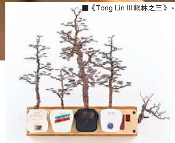
■《Tong Lin III 銅林之三》。

「我的工作室現在像一間工廠，堆滿了到處撿回的物料，朋友饋贈的電視機內膽，鴨寮街二店買來的水