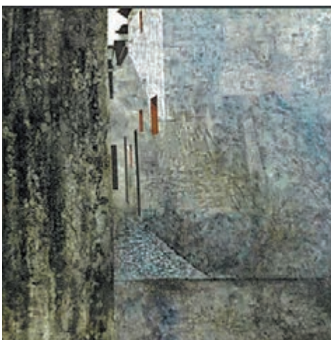
■黃冠餘《江南》1982年作 油彩畫布 估價：70萬至90萬港幣