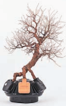
■《Country Explorer III 郊遊探勝之三》