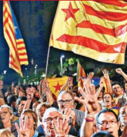
獨派支持者大事慶祝。