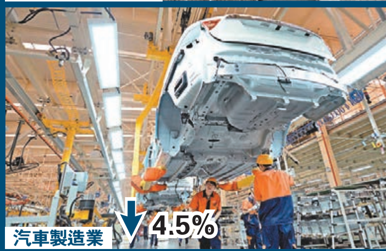
汽車製造業 ↓ 4.5%