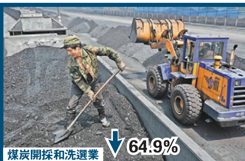
煤炭開採和洗選業 ↓ 64.9%