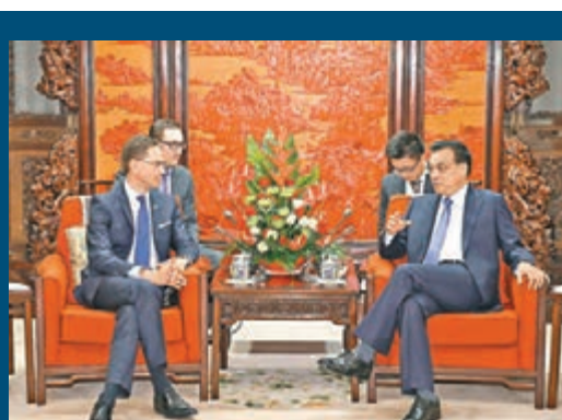
李克強昨日在北京會見歐委會副主席卡泰寧。

香港文匯報訊 中國國務院總理李克強昨日在北京會見歐盟委員會副主席卡泰寧時說, 中國經濟運行今年仍保持在合理區間, 新的增長動能正在形成, 中國經濟長期向好的基本沒有變。