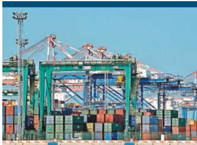
前8月國企利潤同比減少6.6%。圖為廈門一國企碼頭。資料圖片

香港文匯報訊 2015年前8個月中國國企利潤更強烈「縮水」, 顯示經濟下行壓力加大。據中新社報道, 中國財政部28日發佈的最新數據顯示, 2015年1-8月國企利潤近1.6萬億元(人民幣, 下同), 比去年同期減少6.6%, 降幅比1-7月擴大4.3個百分點。