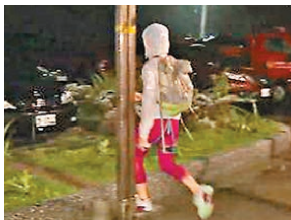
被指獲救後態度惡劣的港女。