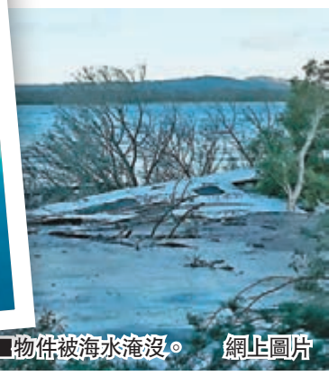
物件被海水淹沒。

澳洲昆士蘭營勝地彩虹海灘昨晚突然發生地陷，海邊出現一個100米長、50米闊、3米深的巨坑，而且不斷擴大至200米長，面積比一個足球場還大，大量海水隨即湧進巨坑，吞噬3輛車和部分營帳。警方和緊急服務隊迅速趕到現場，安排約140名遊客和部分車輛緊急疏散，無人受傷或失蹤，海灘已交由相關部門接管。