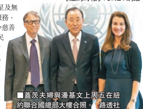
蓋茨夫婦與潘基文上周五在紐約聯合國總部大樓合照。路透社

民上網並非完全出於慈善，「我們所有人都得益」，言下之意即此舉將增進fb的商業利益。批評者指，fb主導的合作項目Internet.org提供的受限制的網絡服務，違背網絡中立原則。此外，由蓋茨夫婦創立的比爾及梅林達·蓋茨基金會於同日推出計劃，改善婦女健康及教育情況。發佈計劃的聯合國秘書長潘基文表示，該計劃已獲投資250億美元(約1,928億港元)。 ■法新社/路透社/《紐約時報》/CNET網站