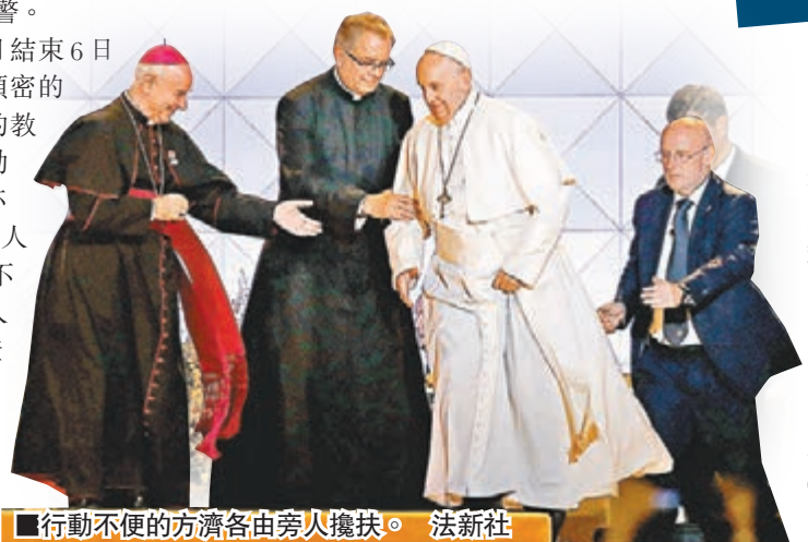
行動不便的方濟各由旁人攙扶。

教宗方濟各同日結束6日訪美之行，連日頻密的行程今年屆78歲的教宗多次顯示出行動不便，上落樓梯亦需要旁人攙扶，令人擔心他是否身體不適。梵蒂岡發言人隆巴爾迪日前證實，教宗有關節問題，需要定期接受物理治療。