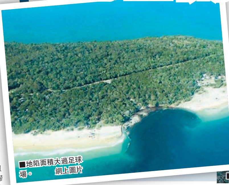
地陷面積大過足球場。網上圖片