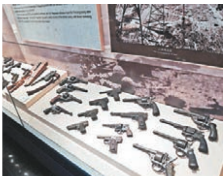
紀念館內的抗戰時期武器。