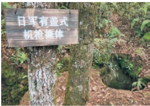
松山戰役遺址仍可見日軍當年挖掘的掩體。