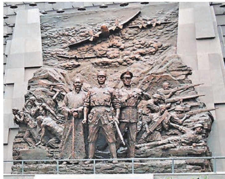
位於騰沖的滇西抗戰紀念館。