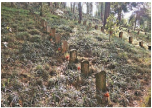
位於騰沖的國殤墓園，安葬了3,000多陣亡烈士。