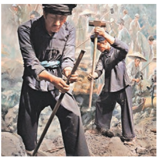
當年雲南人民以純手工修築滇緬公路的場景。