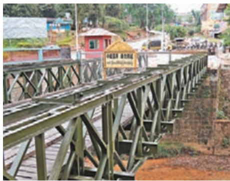
10萬中國遠征軍當年跨過畹町橋出國作戰。圖上方為緬甸國境線。