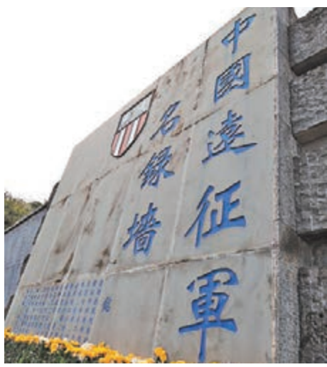
滇西抗戰紀念館外的中國遠征軍名錄牆。