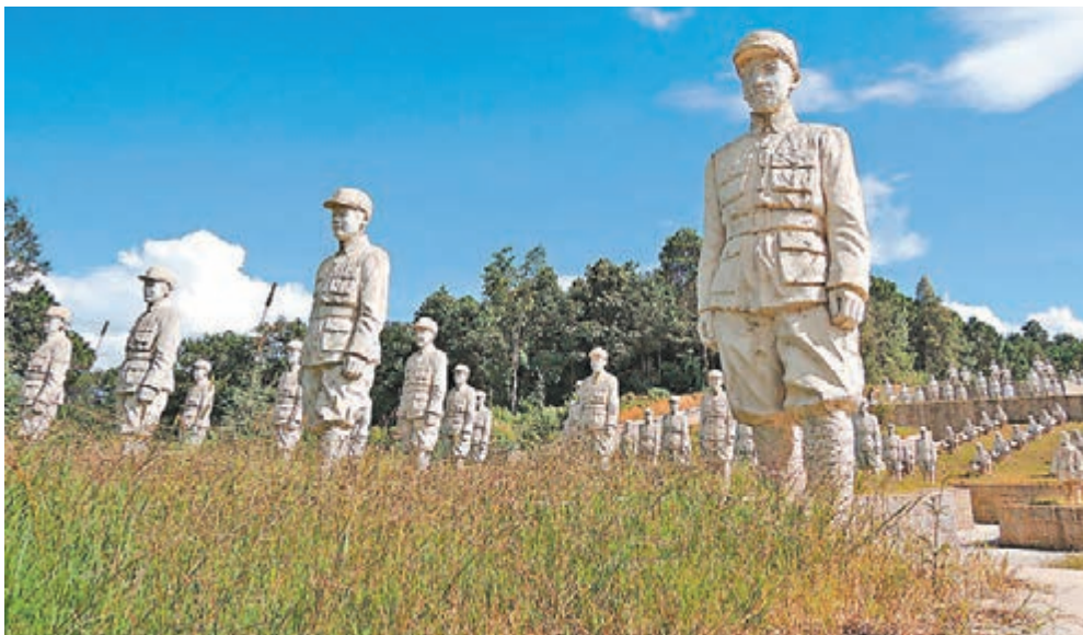
位於雲南龍陵縣的中國遠征軍雕塑群。

作為經歷過艱苦抗戰的老兵，盧彩文對閱兵式展出多款新型國產武器深感興奮，知道保衛國家領土安全有保障，「那些武器亮得太高興！我們國家要強大，就要有現代化的裝備，如果我們沒有自家的武器，武器又比不上人家，我們要富國強軍就很難了。如果我們沒有力量，中國祈求和平也難實現；要保衛世界的和平，就要有實力，別人就不敢輕舉妄動，否則談和平是不可能的。所以看見這些武器，不管是海陸空的，那樣龐大的武器裝備方陣，威武雄壯，感到很興奮。」他認為，不管美國是否參與閱兵，他們與中國人的感受也不可能一樣，「因為我國曾深陷那場災難，美國人的心情和我們根本不一樣。不過可以肯定，大多數人民是站在我們一邊的。通過這次閱兵，可讓世界人民知道我們國家強大。我們要扛起重保衛世界和平的大旗，就更更要鞏固國防力量，實現軍隊現代化。」