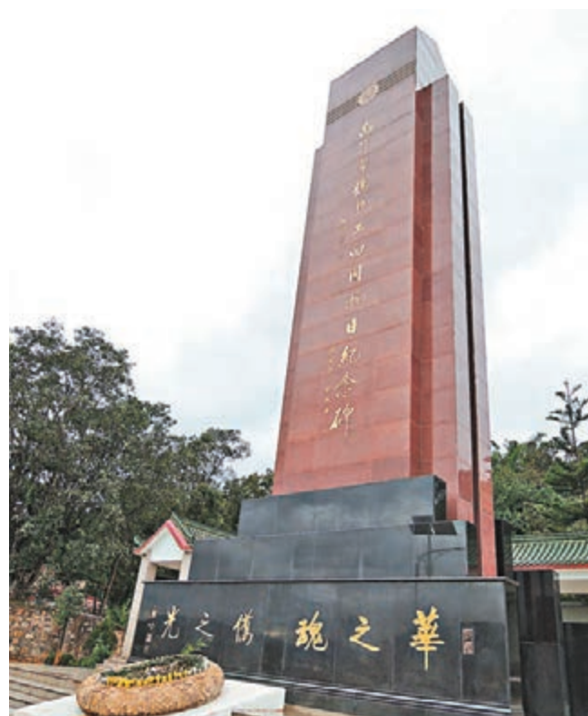
位於畹町的南洋華僑機工回國抗日紀念碑。