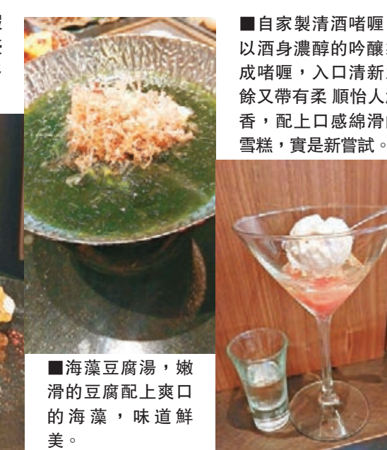
■海藻豆腐湯，嫩滑的豆腐配上爽口的海藻，味道鮮美。