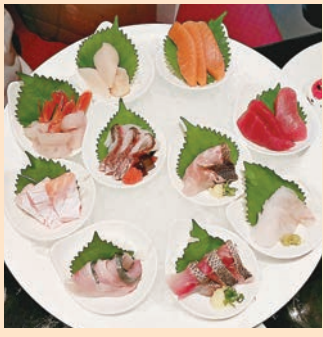
■別格之十點刺身大拼盤，集合十款珍味，以豐盈刺身邀請食客共同慶祝十周年之喜。