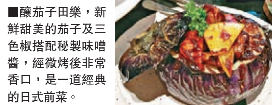
■釀茄子田樂，新鮮甜美的茄子及三色椒搭配秘製味噌醬，經微烤後非常香口，是一道經典的日式前菜。