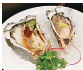
■真牡蠣(兩款口味)肥美多汁，肉厚味濃，配上獨有的柚子酢和 Wasabi 酢調味，帶給你全新味覺享受。

■日本活帆立貝刺身肥美肉厚，質感幼滑細膩，極富彈性，味道像海水般鮮味甘甜，讓人難以抗拒。