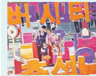
■「韓國潮語」花燈盛會

今天就是中秋節了，加上還是星期天，可以放假，你們想到到哪兒慶祝嗎？筆者發現不少商場趁這個假期，特別舉辦一些中秋節活動，例如We 嘩！充氣嘉年華便於與海城打造超時空感覺的主題樂園，接近40呎高的「宇宙探索屋」、讓小朋友體驗發掘閃閃樂趣的「星星探索機」、仿如置身星際中跳躍的「月球彈床」、由美國研發的互動體感遊戲「地球探索體驗」及其他各式攤位遊戲，務求令小朋友在商場的天幕下透過遊戲探索宇宙，享受假期歡樂。