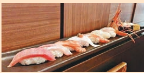
■千兩特選壽司拼盤(10件)包攬炙燒黑椒三文魚、炙燒大吞拿魚腩(醬油)、炙燒牛油帶子等多種不同鮮味。

今年適逢餐廳十周年，為了把品牌的「別格」元素全方位帶給食客，迎來了嶄新的全新餐目設計。餐廳還邀請了在日本屢獲殊榮的gtdi設計公司，並由該公司總裁Henry Ho親自為餐廳度身訂造「別格」的餐目，必定為大家帶來耳目一新的感覺。而為了隆重其事，餐廳更特推別格之十點刺身拼盤及別格之十點刺身大拼盤，以豐盈刺身邀請食客共同慶祝十周年之喜。