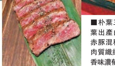
■朴葉三元豚，朴葉出產由黑、白、赤豚混種的豚肉，肉質纖細帶脂肪、香味濃郁。

■勞斯本身是學油畫專業的，曾任職電台美術部管理層，亦愛好鑽研玄學風水，形象包裝，由於經常幫助朋友化解疑難雜症，漸漸累積了一定的戰績，如今請他在此同大家分享，大家可透過真實事例，學到一些簡單風水常識。 文：勞斯 yukkongsir@yahoo.com.hk