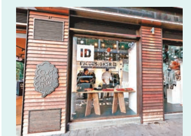
■「I'm Designer」Pop-up Store 期間限定店

另外，自認潮流人的，就不可錯過由香港貿易發展局全力策動的 FASHIONALLY，活動由即日起至10月6日在銅鑼灣潮店 GUMGUMGUM 舉行「I'm Designer」Pop-up Store 期間限定店，發佈新勢力時裝品牌 2015 秋冬系列，於店內展覽及發售。FASHIONALLY 為 GUMGUMGUM 店內內外反轉佈置，讓9個設計品牌當一晚主角。加入中秋節元素的時尚派對，由穿着 AW15 新裝的模特兒，引領一連串驚喜活動及 DJ Music；FASHIONALLY 更發佈了首部 Fashion Film，將時裝注入不同媒體，由「時裝」當主角說故事。