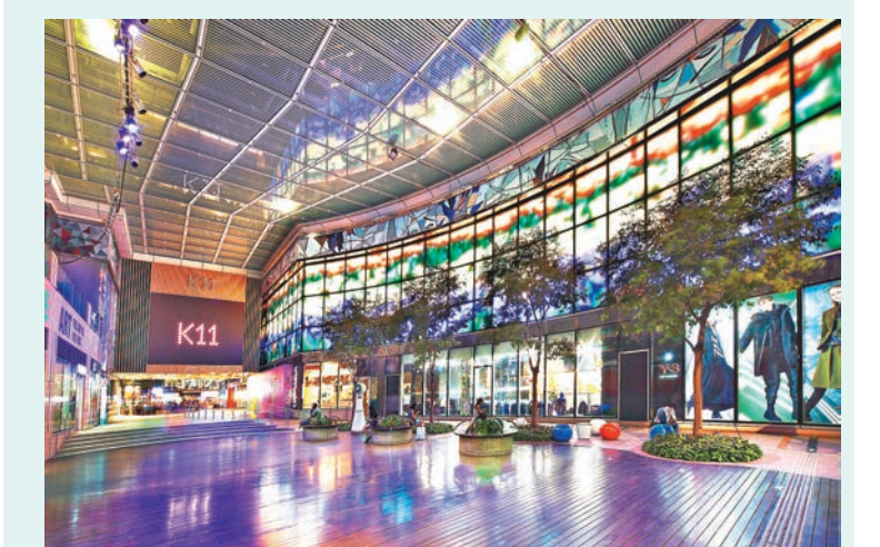
■「A Date with Moonlight Movie」

最後，如你想在中秋節欣賞電影，可以於今天到 K11，這兒為延續傳統與現代藝術新思維的 Crossover，於今年中秋推出自家月餅禮盒外，更特意安排了「A Date with Moonlight Movie」，讓公眾免費品嚐商場推出的自家月餅外，更可佐以 Florte 茶，同時觀賞獨立電影《戀人路上》，歡度中秋。