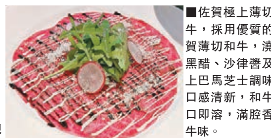
■佐賀極上薄切和牛，採用優質的佐賀薄切和牛，澆上黑醋、沙律醬及灑上巴馬芝士調味，口感清新，和牛入口即溶，滿腔香濃牛肉味。