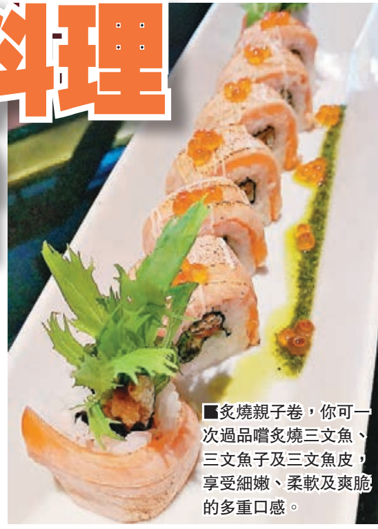
■炙燒親子卷，你可一次過品嚐炙燒三文魚、三文魚子及三文魚皮，享受細嫩、柔軟及爽脆的多重口感。

談起新店裝潢，它是日系傳統與時代感並重，以木色牆身搭配紅色座椅，打造出舒適環境，為食客帶來用餐極尚享受。值得一提的是，新店是千兩首間沒有迴轉帶的分店，縮小了店員與食客的距離，增強互動之餘，大大提升了用餐時的親切感。