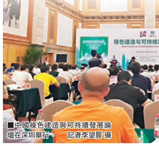
中國綠色建造與可持續發展論壇在深圳舉行。

香港文匯報訊(記者 李望賢 深圳報導)隨着環境問題的凸顯，綠色發展在中國日益受到重視，綠色建造也逐漸成為社會的共識。中國綠色建造與可持續發展論壇日前在深圳舉行，來自中國工程院20位院士、有關科研院所及高校專家教授代表參加論壇，發佈中國綠色建造與可持續發展的前沿科技成果，探討中國綠色建造的發展方向。參會者均強調，建築過程應減少能源消耗。