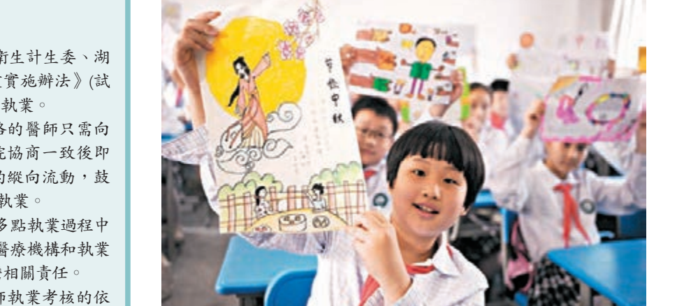
安徽倡節儉過節 臨近中秋佳節，安徽省合肥市蜀山區文苑社區聯合翠庭園小學的學生們開展「倡節儉度中秋」主題活動，學生們通過自己的圖畫倡導適度節儉地度過一個美好的中秋節。

重慶 香港文匯報訊(記者 孟冰 重慶報導)記者日前從重慶市人大獲悉，《重慶市環境保護條例(修訂草案)》正在進行分組審議，草案新設了水污染防治相關章節，明確規定市、區縣政府應當以改善水環境質量為核心，優先保護水源。其中該條例對飲用水水源保護提出要求，規定市、區縣政府應建立飲用水水源保護區域制度，開展飲用水水源規範化建設，依法清理飲用水水源保護區內違法建築和排污口。