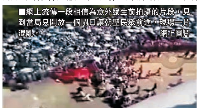
網上流傳一段相信為意外發生前拍攝的片段，見到當局只開放一個開口讓朝聖民眾前進，現場一片混亂。網圖

沙特阿拉伯麥加朝聖活動人踩人慘劇，昨日增至719人死亡、863人受傷，中國外交部證實死者包括1名中國公民；由於當局及醫院仍在點算人數，死傷人數預計還會上升，伊朗