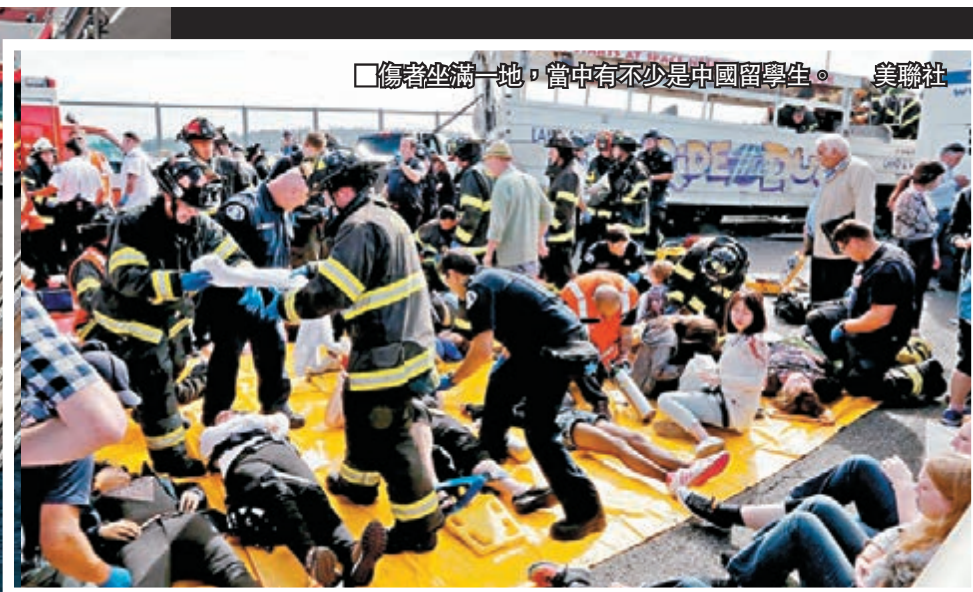
傷者坐滿一地，當中不少是中國留學生。