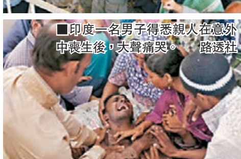
印度一名男子得悉親人在意外中喪生後，失聲痛哭。