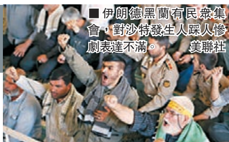
伊朗德黑蘭有民眾集會，對沙特發生人踩人慘劇表達不滿。