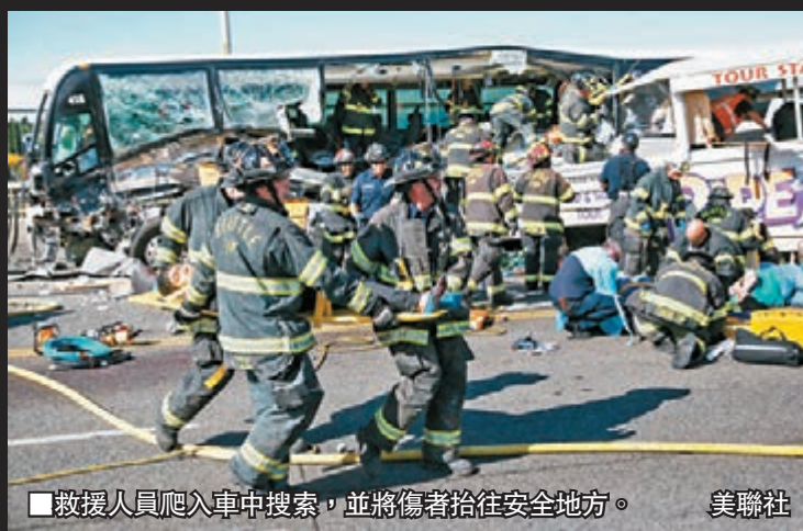
救援人員爬入車中搜索，並將傷者抬往安全地方。