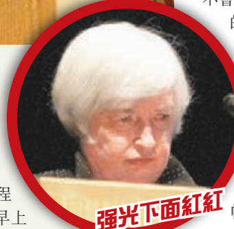
耶倫在演說時多次咳嗽不適。

圍繞聯儲局加息的不確定性加劇金融市場波動，美股道瓊斯工業平均指數自上周議息以來累跌3.2%。聯儲局的決定亦牽動其他地方的貨幣政策，挪威及烏克蘭本周相繼減息，原本預期會跟隨美國加息的土耳其及墨西哥則暫時按兵不動。摩根大通經濟學家漢斯萊指，聯儲局延遲加息或無意中為全球各地推行更寬鬆貨幣政策打開大門。