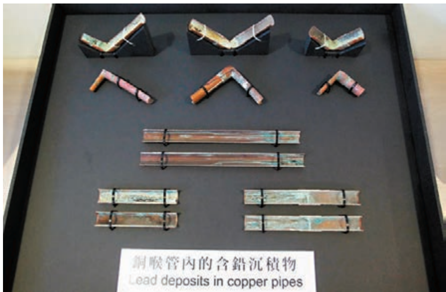
銅喉的變色部分屬鉛的沉積物。小組今次在眾多銅喉焊接位,發現含33%至41%的含鉛量。

專責小組亦檢測了供水系統所有部件另外3種重金屬,包括鎘、鎳及錫的釋放量,結果顯示在啟晴邨康晴樓單位的廚房及洗衣機水龍頭檢測到鎘。然而水龍頭內只有少量的水,放水一兩秒可以將鎘沖走。鎘和鎳在各裝置的釋測試結果都低於可檢測水平,即含量低於每公升水1微克。