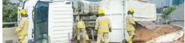
■重型泥頭車在環保大道失事撞屏障後翻側現場。

香港文匯報訊（記者 杜法祖）將軍澳環保大道昨晨發生翻車意外，一輛滿載沙泥泥頭車沿環保大道往工業邨方向行駛，途至將軍澳運動場對開行車天橋時，突然失控撞向隔音屏障後翻側，滑行30米始停下，泥車司機僅受輕傷自行爬出車外，事後因涉嫌「危險駕駛」被警方拘捕，受