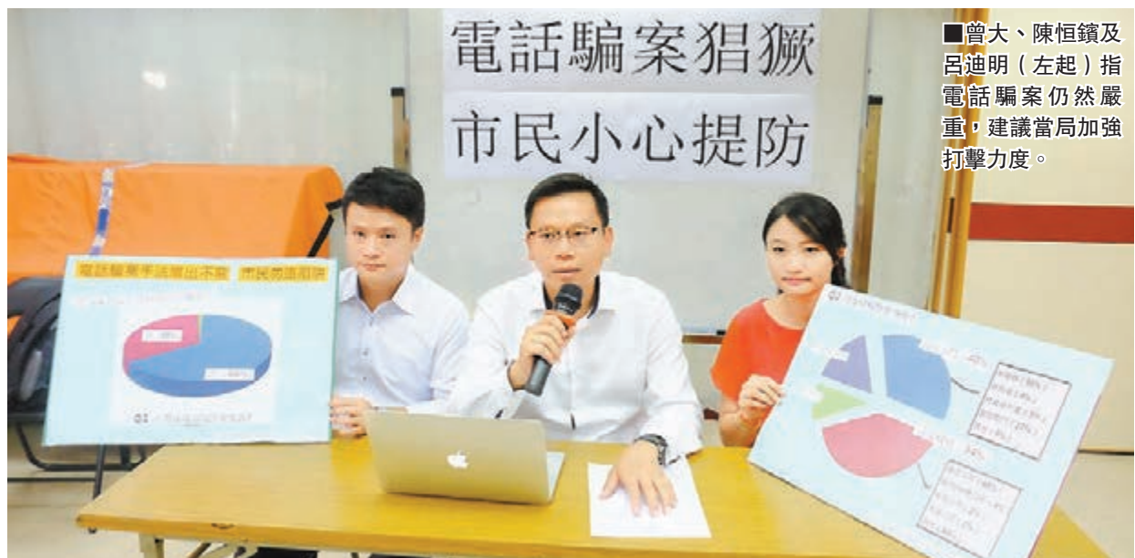
電話騙案猖獗 市民小心提防

根據警方資料，電話騙案在過去8年來大幅飆升，由2008年的1,400宗急升近一倍，至去年的2,200宗。單是今年1至8月，警方已接獲2,500多宗報案，損失金額達2.6億。