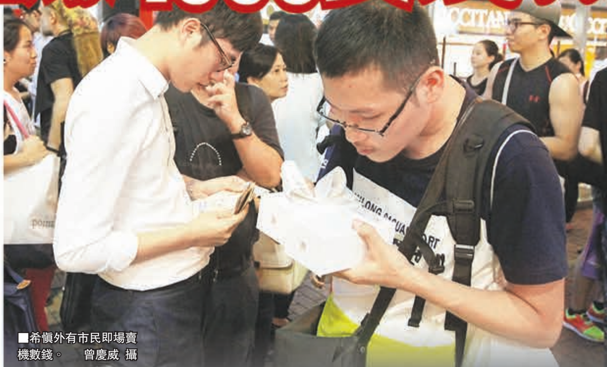
希慎外有市民即場賣機數錢。