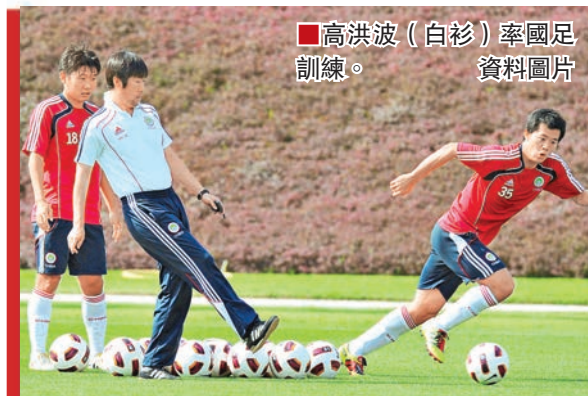
高洪波(白衫)率國足訓練。資料圖片