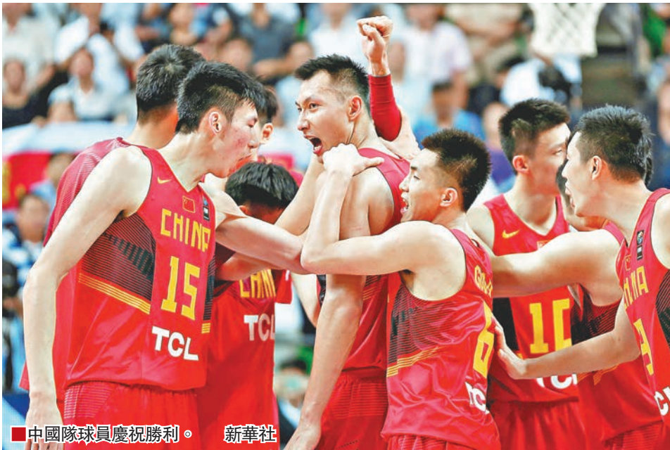
中國隊球員慶祝勝利。