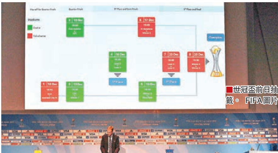
世冠盃前日抽籤。