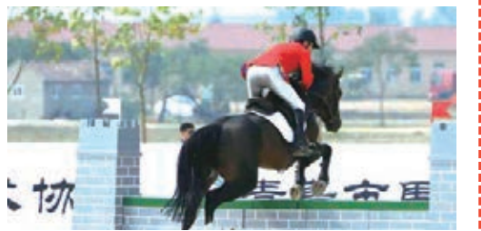
■青島2015休體大會馬術比賽。