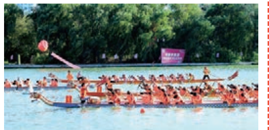
■青島2015休體大會龍舟比賽。