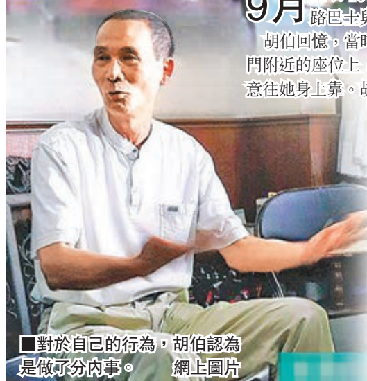
■對於自己的行為，胡伯認為是做了分內事。