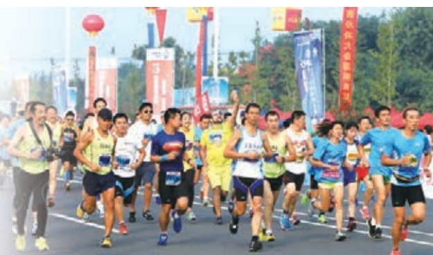
■青島2015休體大會馬拉松比賽。

廣場、月湖廣場、運動員媒體村進行文藝演出27場，參演人數達到3300餘人。組織在萊西各鎮(街道、開發區)、社區文化廣場等場所進行文藝演出活動110餘場，參演人員超過7000餘人。還在萊西市文化中心、崔子範美術館等場所舉辦了13場大型書畫、攝影展覽，吸引了50餘萬人次前來參觀。