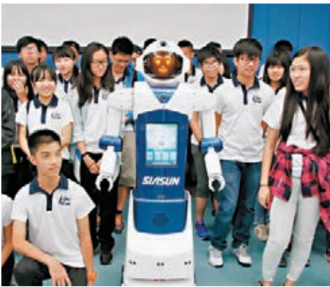
■遼寧籌建高校首個機器人科學與工程學院。圖為青少年團體參觀新松機器人公司。