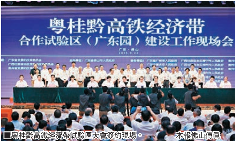
■粵桂黔高鐵經濟帶試驗區大會簽約現場。

香港文匯報訊（記者 蘇徵兵 佛山報道）首屆粵桂黔高鐵經濟帶合作試驗區聯席會議22日在佛山南海召開，連接粵港澳，通達粵桂黔，溝通東盟的高鐵經濟帶合作試驗區拉開序幕。會議透露，泛珠三角合作有望納入國家「十三五」規劃、上升為國家戰略，粵桂黔高鐵經濟帶將是泛珠合作的重要內容。港澳資本也將在2017年廣深港高鐵香港段開通後，融入粵桂黔高鐵經濟帶，深入大西南腹地，廣西、貴州等地高山無污染綠色蔬菜和生態養殖的雞鴨豬羊肉，也將通過高鐵運輸，當天就能達達港澳家庭的餐桌。