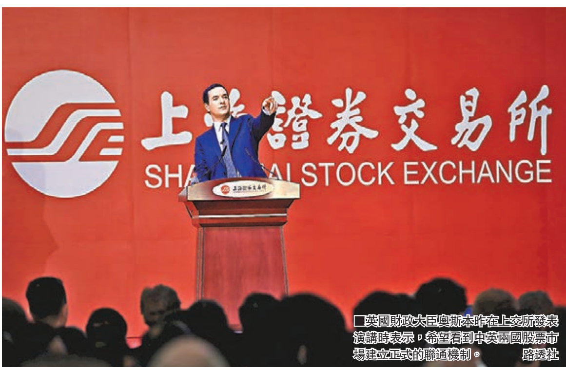
英國財政大臣奧斯本昨日在上海證券交易所發表演講時表示,希望看到中英兩國股票市場建立正式的聯通機制。

外界評論,奧斯本此次訪華背負着加強與中國經濟關係的任務。「若我們保持當前與中國貿易的份額,2020年之前英國出口總值將超過300億英鎊;若中國