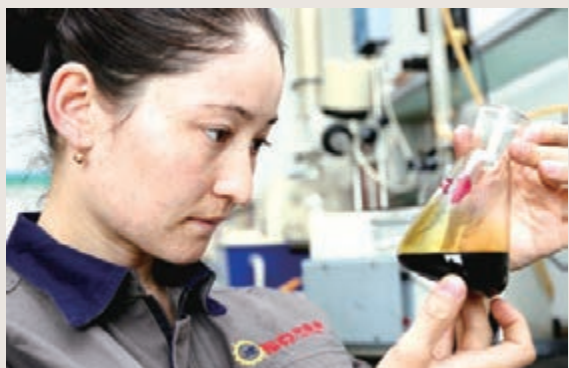
■福克油品質檢員正在化驗油品。

上海大眾汽車(新疆)有限公司、新疆新治華美科技有限公司等涉及製造、環保、電力、化工、服裝等不同行業的15家企業也紛紛搶抓經開區(頭屯河區)全面承接絲綢之路經濟帶核心區「五大中心」建設重大機遇，搭乘經開區(頭屯河區)政府服務企業的快車，積極作為，獲得經開區(頭屯河區)管委會、區政府頒發的「2014年度最具成長力工業企業」榮譽稱號。