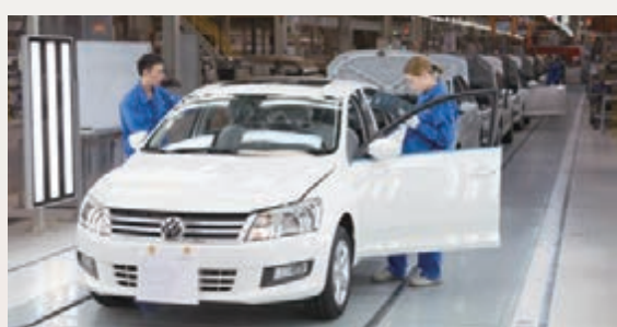
■上海大眾生產線場景。

當代經濟社會，市場總是青睞於那些技術更先進、產品更優質的企業。「百舸爭流千帆競，借海揚帆奮者先」。只有勇立潮頭，敢於挑戰，才能在激烈的競爭環境中贏得勝利。經開區(頭屯河區)評選出的2014年度十家優秀科技創新企業便是這類企業中的佼佼者。這些企業有裝備製造業領域的巨頭，也有石油化工行業裡的龍頭，行業雖說不同，但對科技創新的追求卻是一致的。