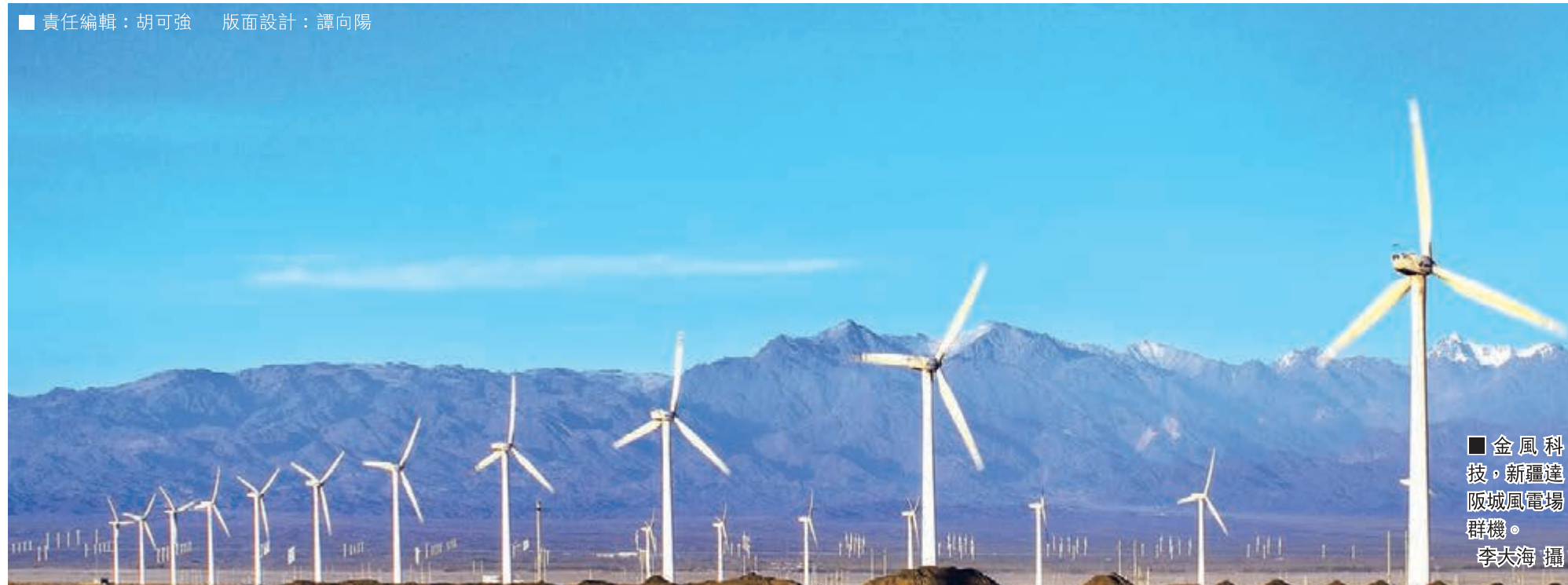
■金風科技，新疆達阪城風電場群機。