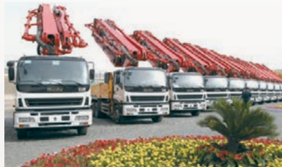
■三一西北重工產業園。

今年，經開區(頭屯河區)將持續加大冶金、風電、食品飲料三大支柱產業配套項目引進和市場拓展力度，鼓勵企業以技術創新、產品升級應對市場波動。最終實現在汽車、機械裝備製造、生物醫藥、現代煤化工等行業中湧現出更多「領頭羊」，並形成新的產業集群。