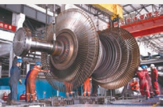
■天山電力30萬千瓦汽輪機檢修現場。

2014年，在全國經濟下行壓力下，許多企業都面臨勞動力成本上升、行業產能過剩、資金緊張、國內需求不足等諸多困難。經開區(頭屯河區)秉承「致力於為企業創造價值」的理念，與駐區企業齊心協力、攻堅克難，企業搶抓發展機遇，着力提高自身綜合競爭力，經受住了市場考驗，顯示出了蓬勃的生命力，亦激活了區域經濟活力。