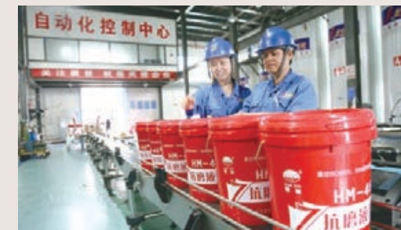
■隆成實業自動化生產線。

「一帶一路」宏偉戰略擎起了中華民族偉大復興的「中國夢」。作為「絲綢之路經濟帶核心區」五大中心的重要承接者，經開區(頭屯河區)將始終與駐區企業同心協力，攜手共進，用新的勇氣、智慧和務實精神，書寫更加壯麗輝煌的「絲路華章」！