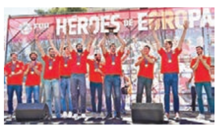
西班牙男籃凱旋。

日前贏得歐洲男子籃球錦標賽的西班牙隊，昨日凱旋回歸祖國，獲首相拉霍伊接見；拉霍伊表示，這面金牌是西班牙於歐洲錦標賽贏得的第十二面獎牌，故此西班牙可謂歐洲錦標賽的第一勁旅。球員跟拉霍伊會面合照後，隨即到馬德里市內廣場跟球迷慶祝派對。