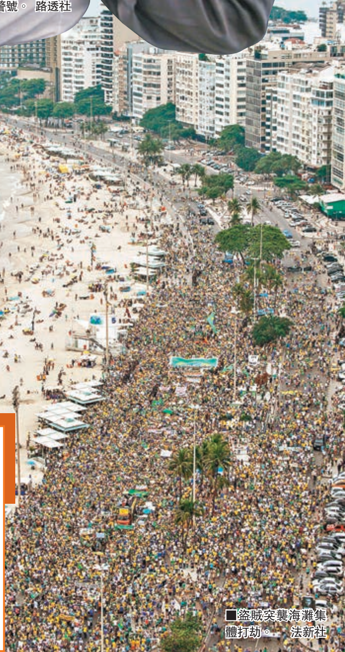
盜賊突襲海灘集體打劫。