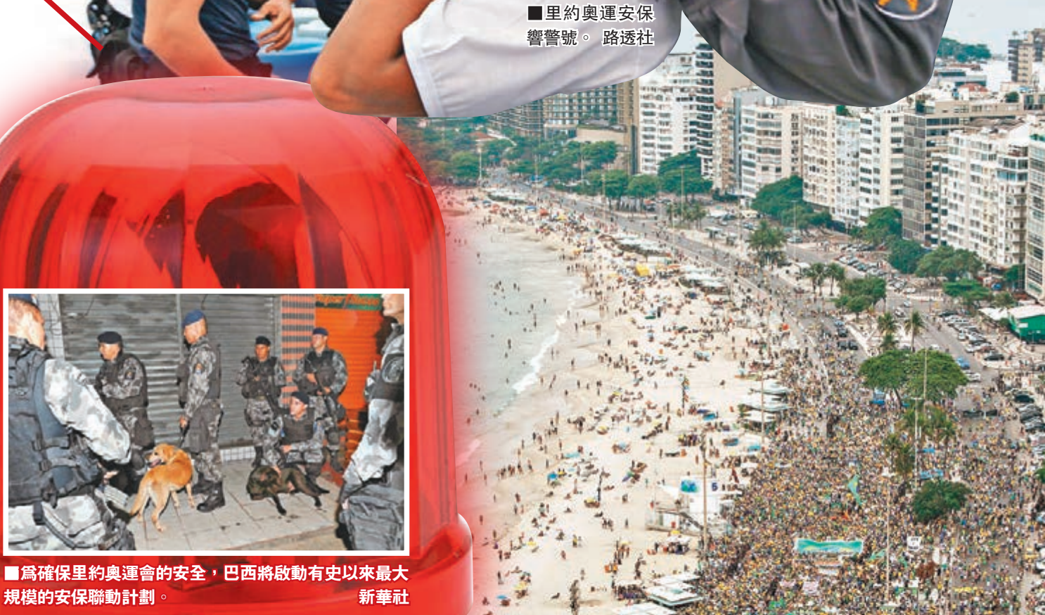
里約奧運安保響警號。

里約州公共安全局7月宣佈，為確保里約奧運會的安全，巴西將啟動有史以來最大規模的安保聯動計劃，來自武警、軍隊、警察和消防部門的總共85000人將協同作戰，這一人數要比2012年倫敦奧運會的安保人數多出一倍。