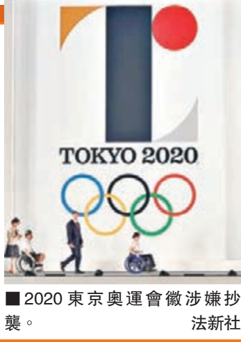
2020東京奧運會徽涉嫌抄襲。