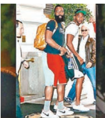
夏頓又穿「一剔」球鞋。

NBA火箭隊球星夏頓在今年夏天和體育品牌「三間」簽下13年2億美元的合約，不過繼先前被抓到穿著贊助商「一剔」球鞋後，夏頓近日又再次被發現穿著「一剔」球鞋。在和「三間」簽下合約後，夏頓和女友卡達夏看電影時被拍到穿著「一剔」球鞋，這讓「三間」高層感到不悅，事後夏頓也向新贊助商溝通談和。只不過夏頓似乎還是沒把這件事放在心上，他在紐約又被拍到穿著「一剔」球鞋，不少人都猜測新贊助商的高層會怎麼想。