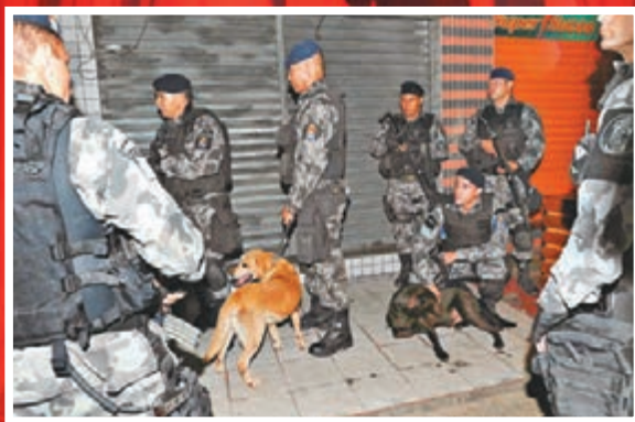
為確保里約奧運會的安全，巴西將啟動有史以來最大規模的安保聯動計劃。