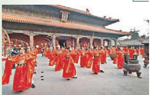
曲阜國際孔子文化節迄今已成功舉辦31屆，在海內外產生了廣泛影響。

以「弘揚優秀傳統文化，建設文明首善之區」為主題的2015中國（曲阜）國際孔子文化節將於本月26日在山東曲阜開幕。