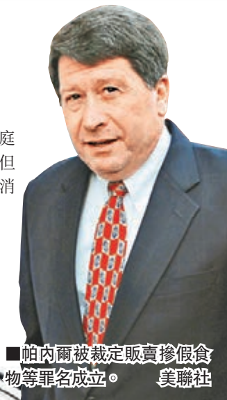
■帕內爾被裁定販賣摻假食物等罪名成立。