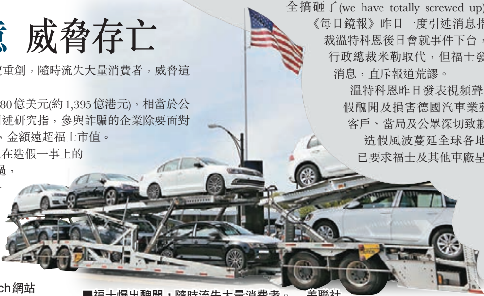
■福士爆出醜聞，隨時流失大量消費者。