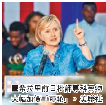
■希拉里前日批評專科藥物大幅加價「可恥」。

美國藥廠近期大舉收購藥物專利，再大幅加價牟取暴利，繼藥企圖靈(Turing)將治療寄生蟲感染藥物Daraprim瘋狂加價55倍後，另一藥廠Rodelis Therapeutics亦被揭於上月收購肺結核藥物Cycloserine專利權，繼而把每30粒藥丸售價由