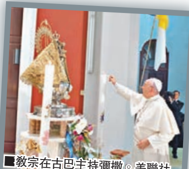
■教宗在古巴主持彌撒。

教宗方濟各昨日結束古巴行程轉往華盛頓，展開首次美國之行，美國總統奧巴馬及夫人米歇爾親自到機場迎接。由於教宗訪問紐約期間會乘坐開篷車，加上適逢世界各國領袖齊集紐約出席聯合國大會，令美國的保安工作壓力空前巨大，預計商業和交通會大受影響。