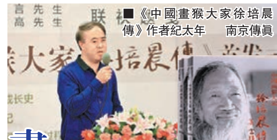
■《中國畫猴大家徐培晨傳》作者紀大年 南京傳真

香港文匯報訊（實習記者王穎 南京報道）日前，由諾貝爾獲獎得主莫言先生和當代著名畫家喻繼高先生聯袂題寫書名，著名作家、藝術評論家紀大年先生撰寫的《中國畫猴大家徐培晨傳》一書正式發行。本書是中國當代畫家傳記中最長的一本，全書共計37萬字。