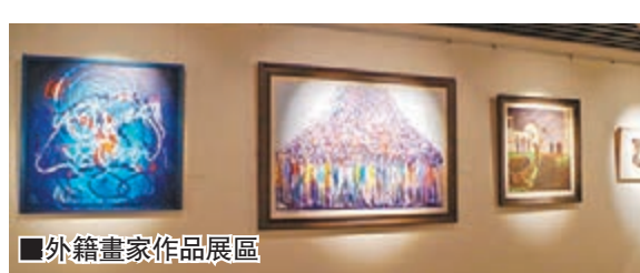
■外籍畫家作品展區