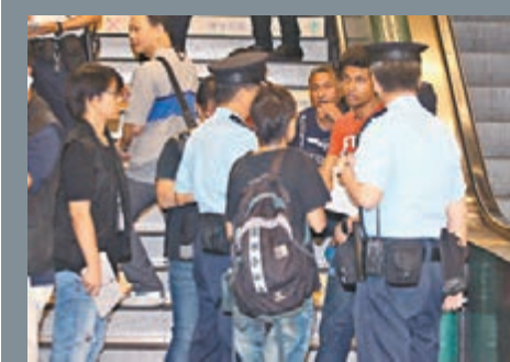
警員向事主的數名趕至「同鄉」了解案情。