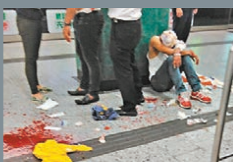
被斬傷頭部的南亞漢坐在地上接受包紮止血。