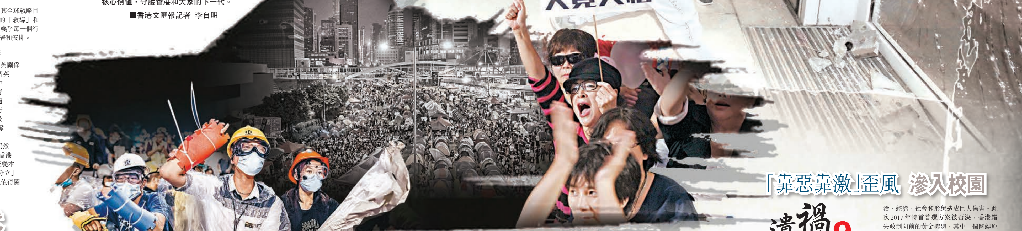
有暴徒在「佔領」期間砸碎玻璃門，暴徒衝進立法會。資料圖片