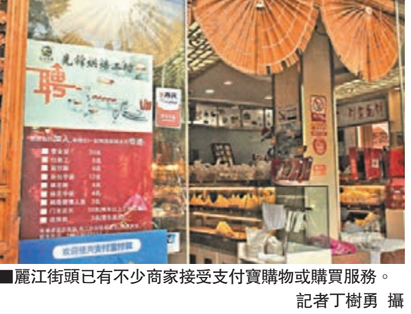
麗江街頭已有不少商家接受支付寶購物或購買服務。

與阿里巴巴的合作，體現了強強合作，希望通過互聯網平台，將麗江的資源優勢轉化為經濟優勢。而阿里巴巴集團副總裁何一鳴在致辭中表示，隨著麗江旅遊業的發展，旅遊麗江的人群以年輕旅遊者居多，他們是互聯網應用的主要人群，是打造「互聯網+麗江」項目的良好基礎，「未來的競爭是大數據的競爭，抓住了年輕人，就抓住了未來。」據介紹，去年麗江接待遊客2,600萬人次，預計今年將達到3,000萬人次，而以年輕旅遊者居多。