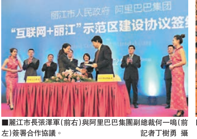
麗江市長張澤軍(前右)與阿里巴巴集團副總裁何一鳴(前左)簽署合作協議。

陳星雲表示，阿里巴巴具全球影響力；而麗江除具有良好的旅遊業發展態勢外，還有人文旅遊資源、高原特色農業資源和中藥材資源，