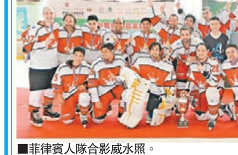
■菲律賓人隊合影慶祝奪標。

「2015香港業餘冰球會冰球邀請賽」昨日在Mega-Box溜冰場上演最後一個比賽日,先後上演金盃、銀盃及洋紫荊組決賽,菲律賓人隊在冰球決賽以3:1擊敗日本三菱商隊封王。至於另外2個組別,台北環球鯊魚隊在銀盃決賽加時後,最終以3:2險勝日本冰球會隊;而澳門冰球隊則在洋紫荊組決賽以2:1反勝卡塔爾大羚羊隊奪標。