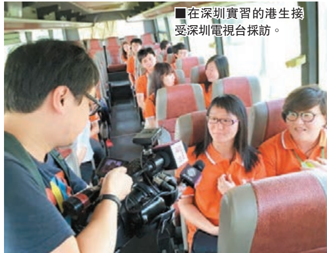
在深圳實習的港生接受深圳電視台採訪。