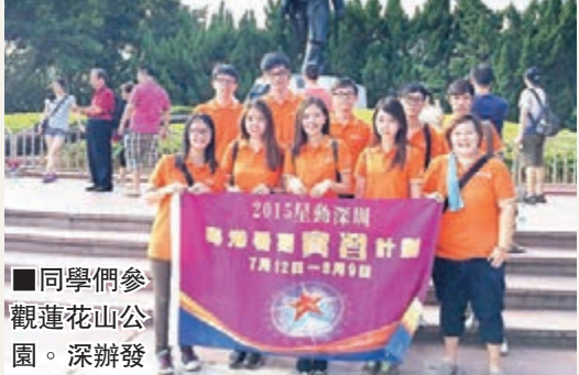
同學們參觀蓮花山公園。深辦發

開始爬,他們已經下山了,才早上5時多啊!」在前往深圳仙湖植物園體驗戶外文化當天,適逢有3名港生生日。午餐期間,未來之星同學會負責人一連捧着生日蛋糕,一邊唱着生日歌向壽星們獻上祝福。3名壽星一起戴上生日帽許願吹蠟燭,連吹3次才把蠟燭吹滅,現場氣氛溫馨又歡快。