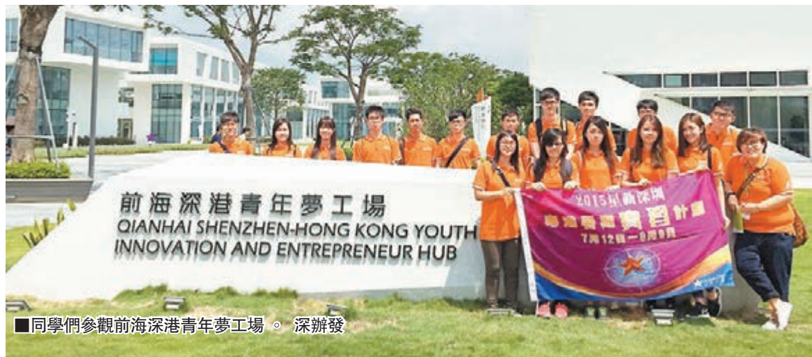
同學們參觀前海深港青年夢工場。深辦發