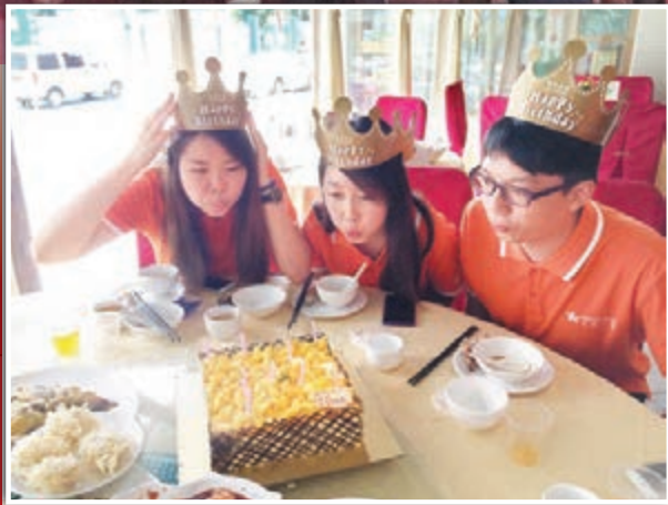
實習期間恰逢3位同學生日,未來之星同學會貼心準備生日蛋糕。深辦發