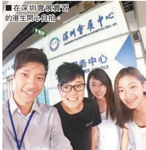
在深開展實習的港生開心自拍。

深港毗鄰,經濟社會發展緊密相連,近幾個月以來,兩地高層數次會面,為兩地進一步合作開拓新的空間。備受關注的深圳前海,作為新一輪改革開放「先行先試」試點地區之一,其定位便是推進與香港的緊密合作和融合發展。