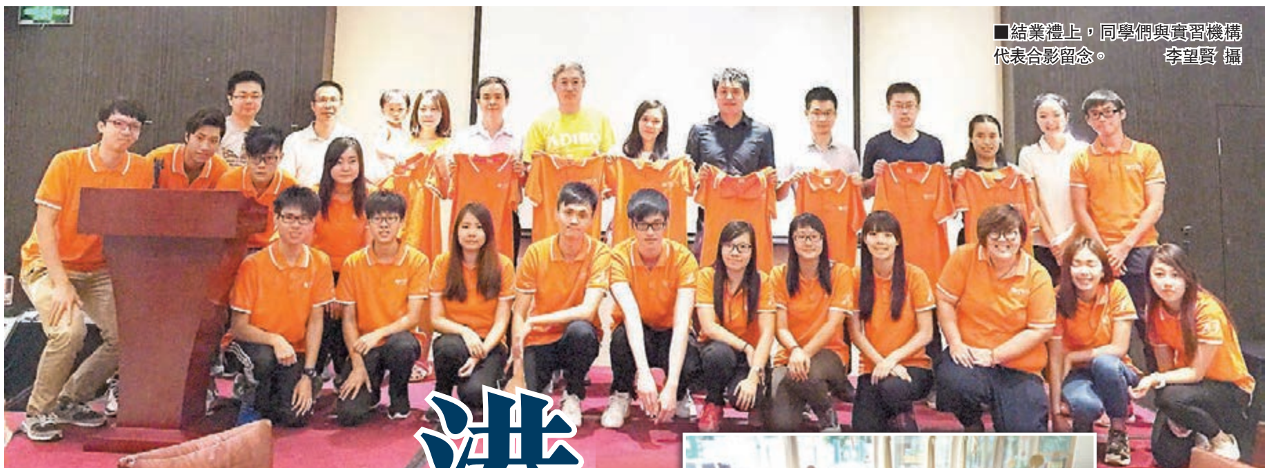
結業禮上,同學們與實習機構代表合影留念。