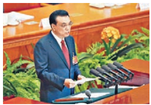
李克強總理早前在兩會時宣佈減關稅。